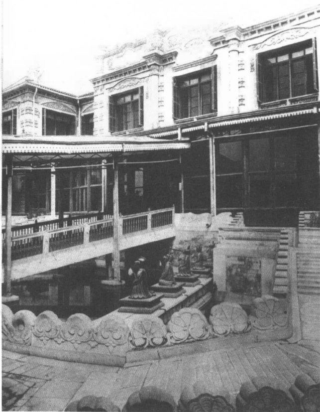
下图：中南海居仁堂国立北平图书馆馆址