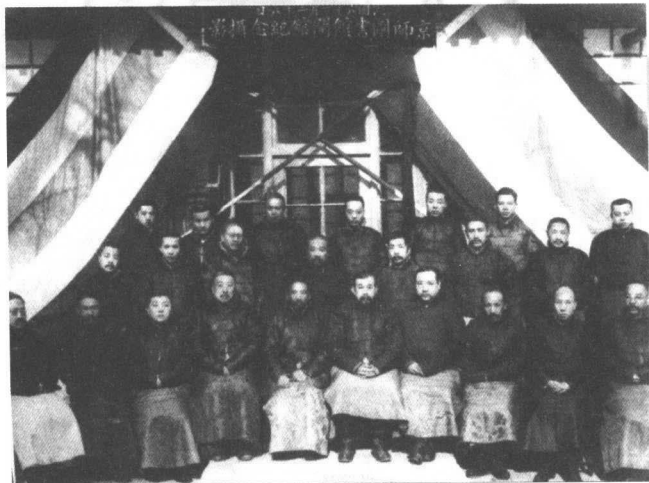
下图：1917年京师图书馆开馆纪念

1909年（清宣统元年）末代皇帝溥仪登基。4月24日，清五朝学部奏请筹建京师图书馆，同年9月9日得到宣统皇帝御批。京师图书馆的创立标志着中国第一座国立图书馆的诞生，首任监督是四品翰林院编修缪荃孙。当时朝廷同意京师图