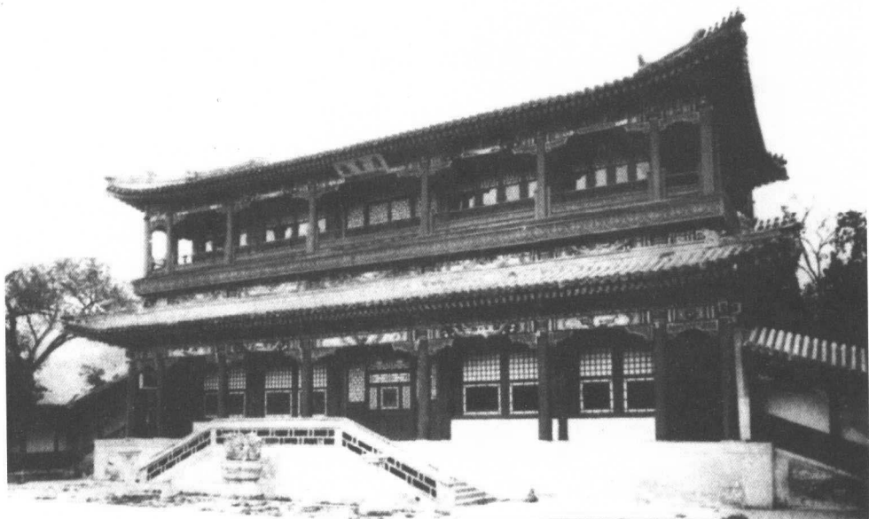
上图：庆霄楼北平北海图书馆馆址