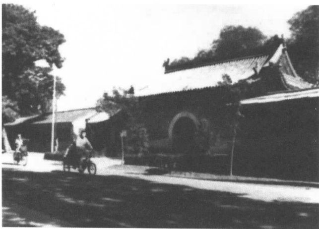
上图：广化寺京师图书馆馆址

中国文化巨匠鲁迅，在1912年到1926年间，任教育部社会教育司第一科长，分管图书馆工作，他曾四处寻找馆舍，筹划建馆。由于广化寺地方过于低湿，对保护图书不宜，京师图书馆在1913年10月就停办了。为了寻找合适的馆址，鲁迅到处奔走。1917年，京师图书馆移至安定门内方家胡同原国子监南学旧址。1926年，鲁迅带着他未完成的梦想，离开北平南下。同年，中华教育文化基金会董