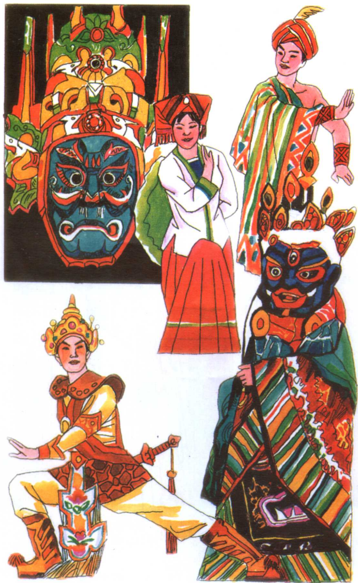
藏戏·壮剧·傣剧·布依戏面具