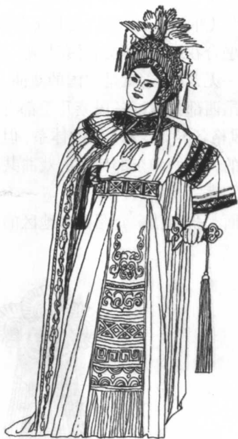
这是《奢香夫人》剧中主人公奢香夫人的造型。

黔剧是流行于贵州省汉族居住地区的一种戏曲艺术。它的前身是一种民间说唱艺术“文琴”(又叫“扬琴”)。“文琴”在清代光绪年间已经盛行,解放后,由一些热心者改为戏曲并搬上舞台,1960年定名为黔剧,成立了贵州省黔剧团,并先后创作了《奢香夫人》、《张秀眉》、《山高水长》等一批优秀剧目。根据侗戏优秀剧目《秦娘美》改编的同名黔剧还被拍成电影,在全国公映,受到欢迎。