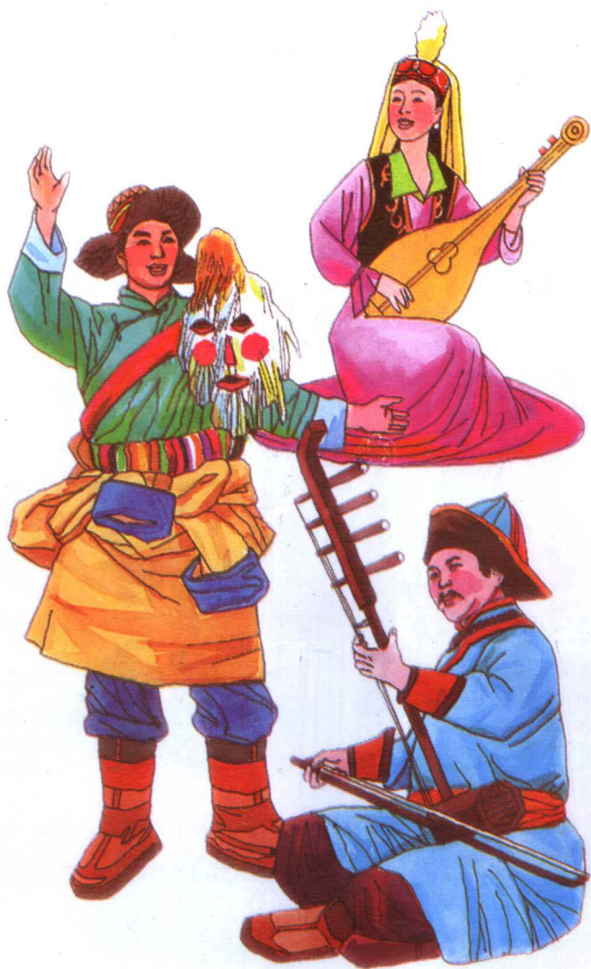
蒙族好来宝·藏族折嘎·哈萨克族冬不拉弹唱