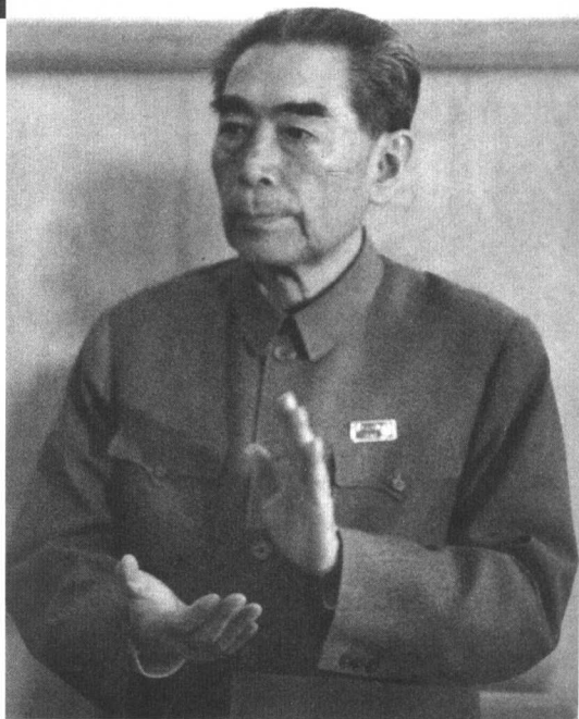
“文化大革命”中的周恩来

澜，周恩来面对严峻的形势，苦撑危局，力挽狂澜，竭尽全力维系党和国家各项工作的运转。