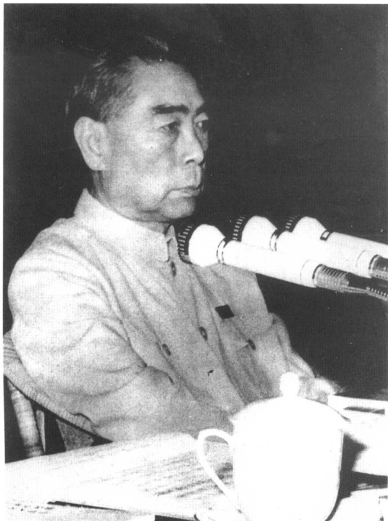
1970年8月，周恩来在中共九届二中全会上。