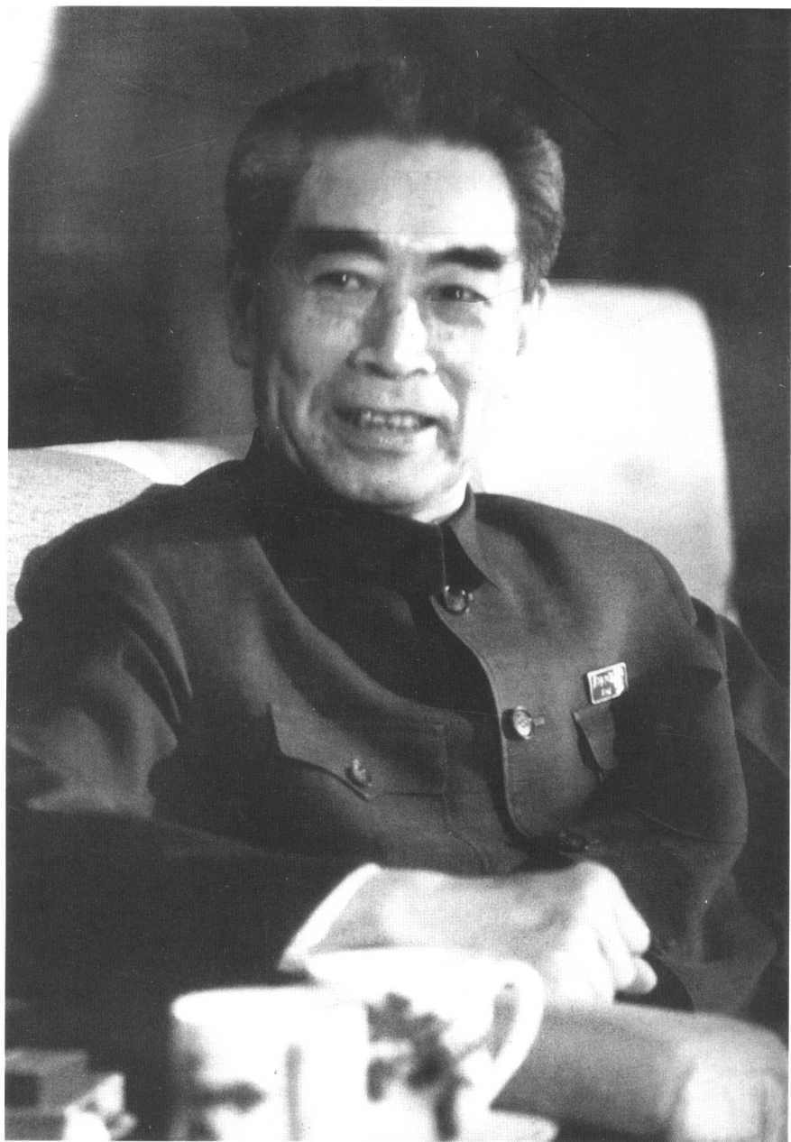
“文化大革命”中的周恩來