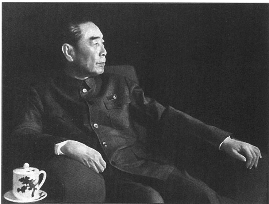
1973年1月，“文化大革命”中的周恩来。