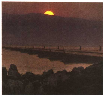
▲ 薛西斯在海峡上建起的浮桥复原

50万人)开始了对希腊的又一次远征。军队从波斯波利斯出发,到达苏萨,取近路向萨迪斯挺进。为了使庞大的舰队顺利入海,波斯曾用3年时间,开掘了一条长1.5英里的运河蜿蜒穿过圣山州直入大海。往日,风暴曾粉碎了他父亲的梦想,但这一次,薛西斯决心不让他的舰队重蹈覆辙。