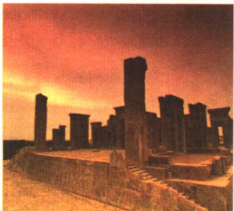
▲ 波斯波斯宫殿遗址