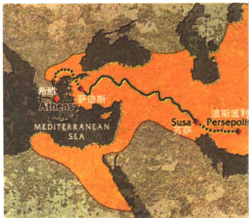
▲ 波斯军队进攻路线图