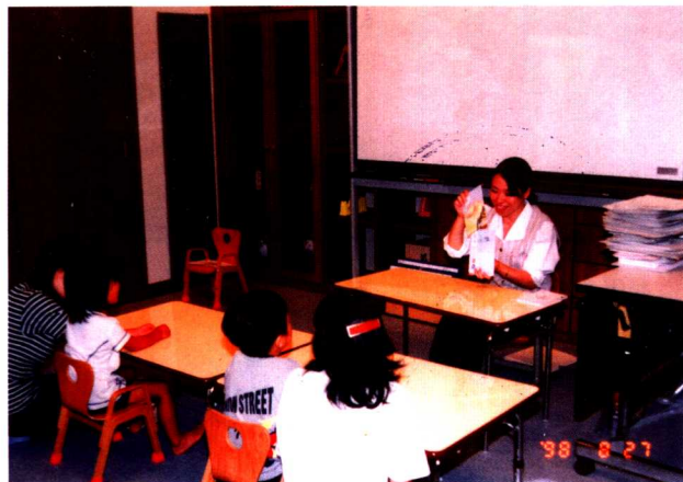
七田儿童学校老师在教儿童开发右脑