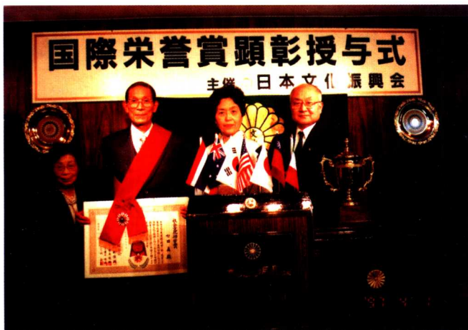
七田真博士在接受日本文化振兴奖赏