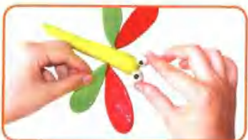
⑤ 粘贴各个部件组合蜻蜓。