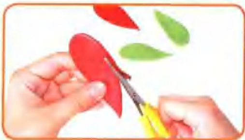
② 用剪刀将彩泥剪出翅膀形。