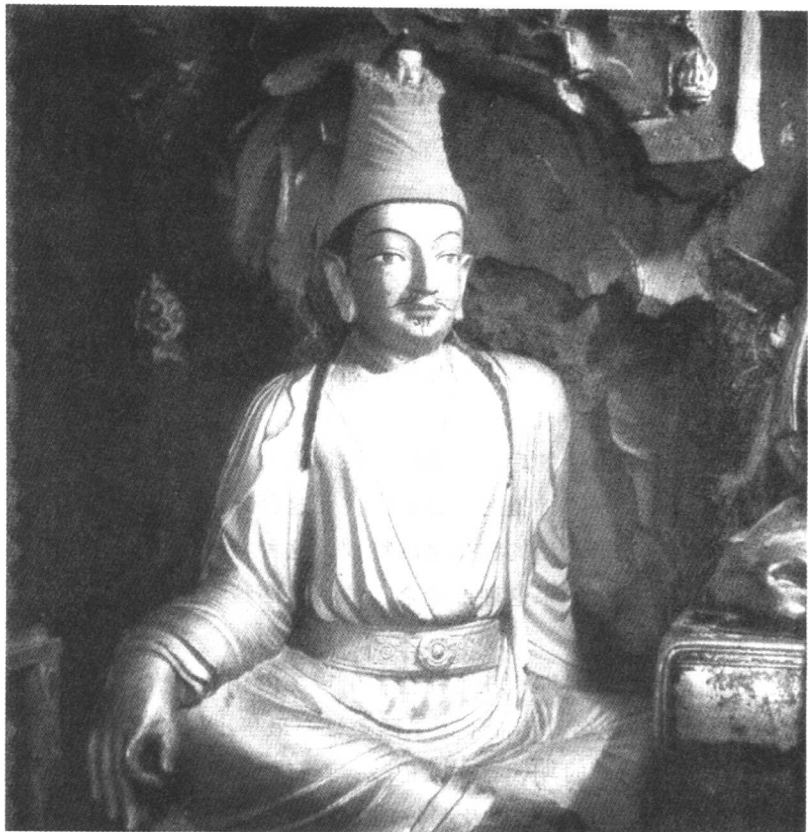
吐蕃赞普——松赞干布塑像

离，外戚象雄、牦牛苏毗、聂尼达波、工布、娘布均亦反叛，父王囊日松赞被毒所害……”。在这一紧要时刻，他受到大臣娘·芒波杰尚囊、噶尔·芒相松囊、琼波·邦赛苏孜、韦·耶察等人的拥戴，被立为吐蕃第三十二代赞普。“王子松赞幼年亲政，先对进毒为首者断然尽行斩灭，令其绝嗣。之后，叛离之庶民复归治下。”公元7世纪初，松赞干布征服西藏各部落，统一了全西藏，建立了强大的奴隶制政权——吐蕃王朝，并着手创立了“吐蕃基础三十六制”，即吐蕃社会的管理体制和法律条文。为了进一步巩固和发展政权，他采取了一系列建政措施。首先，在拉萨建立都城；其次，划分辖