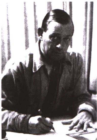
阿尔瓦·阿尔托在美国，1948年

1898年，阿尔瓦·阿尔托生于芬兰库奥尔塔内镇，1903年随全家移居芬兰中部城市于韦斯屈莱，并在那里接受中小学教育。1916年阿尔托考入赫尔辛基工业专科学校建筑学专业，独立战争使他直到1918年才正式入学，在校期间，阿尔托学业超群。