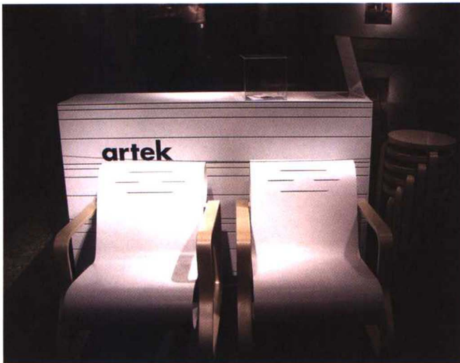
Artek 公司在北京世纪坛展览现场, 2005 年

1935 年阿尔托夫妇及其好友古里申夫妇成立 Artek 公司, 主要生产销售阿尔托夫妇设计的家具、灯饰和纺织品, 并将它们推向国际市场。Artek 总部设在芬兰, 拥有四个陈列馆, 分别在赫尔辛基、埃斯普、图尔库以及斯德哥尔摩。Artek 不仅是一家成功的企业, 同时致力于推广和发展创办人的现代主义精神, 向世人展示宽广的文化前景和先驱精神。现在 Artek 继续巩固它在设计领域的核心地位, 并密切关注当今流行趋势、生活方式的变化以及工业技术发展的最新动态, 对现代主义发展做出极大贡献。