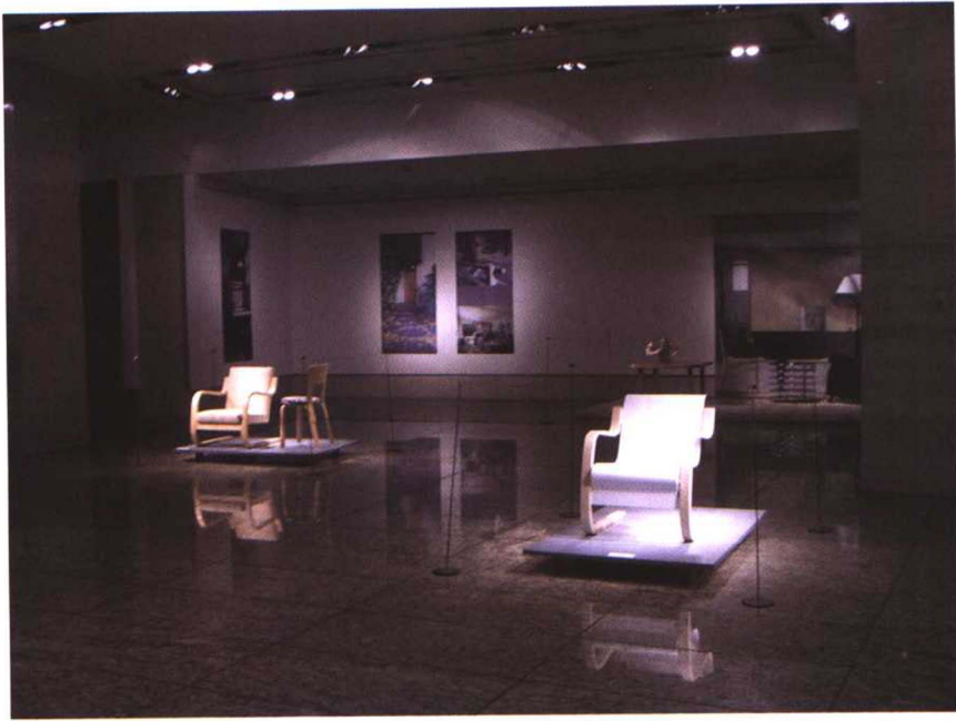
Artek 公司在北京世纪坛展览现场，2005 年