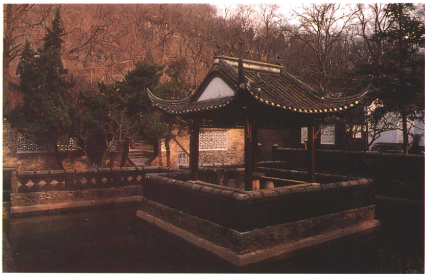
滁州琅琊山方池及影香亭