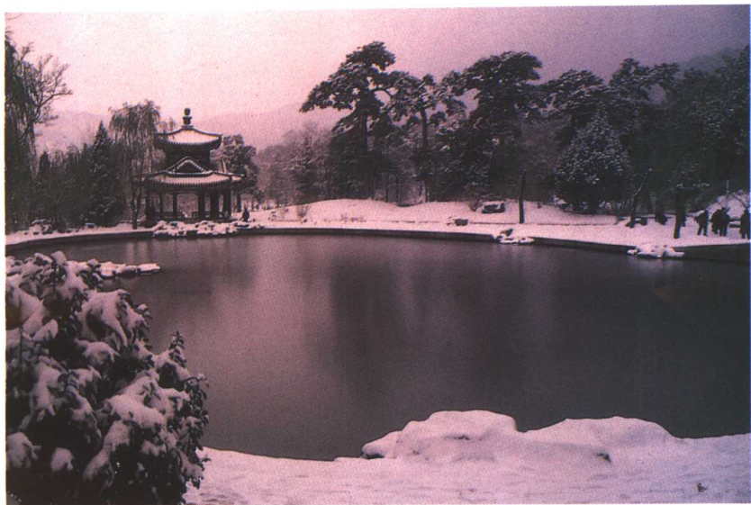
北京香山眼镜湖雪景