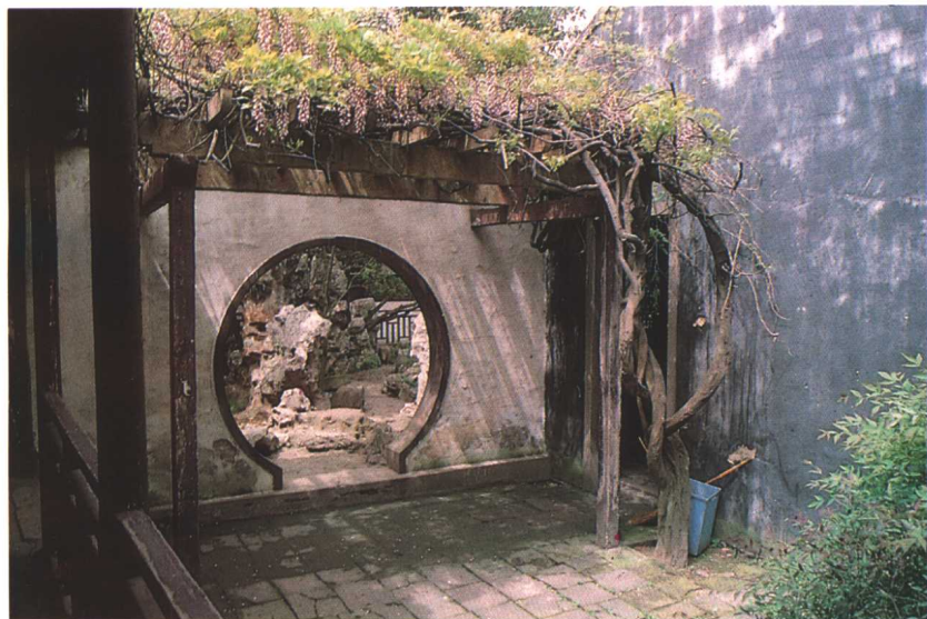
无锡寄畅园秉礼堂门洞对景