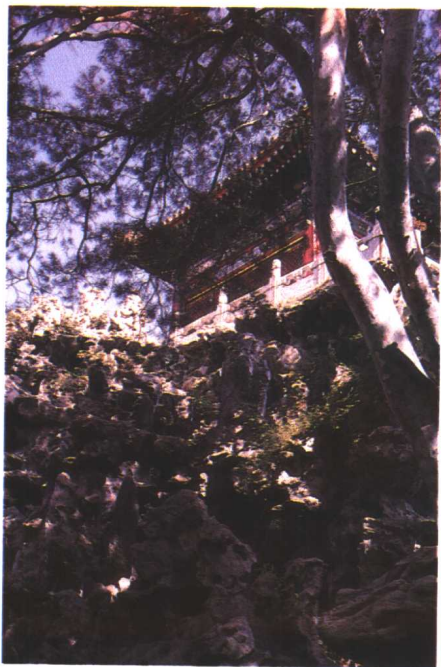
北京御花园假山上景亭