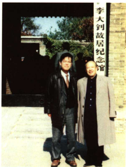
张静如先生与日本学者斋藤道彦参观李大钊故居纪念馆