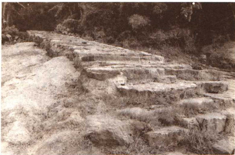
传说上图为袁崇焕青年时代跑马射箭之地

袁崇焕念书准备参加乡试。乡试每三年一次，秋天举行，也称“秋闱”，在省城桂林考试，由主考官主持，考试三场，每场三天，考中为举人。万历三十四年（1606年），袁崇焕在广西桂林丙午科乡试中，考中举人。这年他23岁。对当时的全国生员来说，考中举人是一件大事。举人每科名额，各省数量不同，人数不多，读书之人，皓首穷经，很难得中。《儒林外史》中的范进，因考中举人，高兴得发了疯。这个例子说明：中举，既是科举考试的一件大事，也是科举考试的一件喜事。清朝《聊斋志异》作者蒲松龄，19岁中秀才后，参加乡试，屡试屡败，“三年复三年，所望尽虚悬”，到老也没有考中举人。袁崇焕23岁中举，年龄不算太大，是比较早地得到了功名。他的心情可从《秋闱赏月》诗中得到反映：