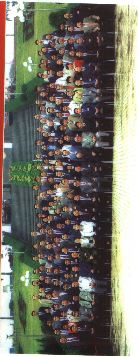
中央纪委、监察部全国案件审理工作会议全体代表合影