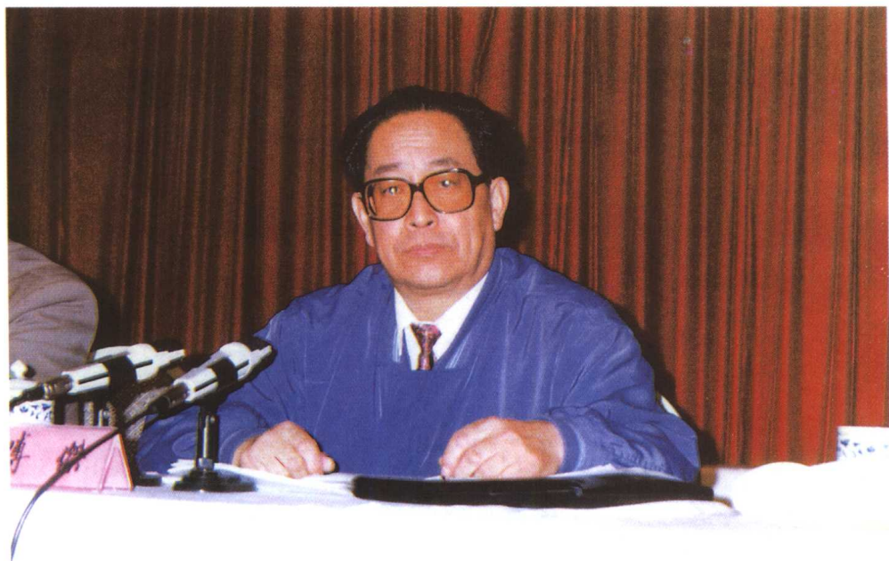
中央纪委常委傅杰同志在全国案件审理 工作会议上作工作报告