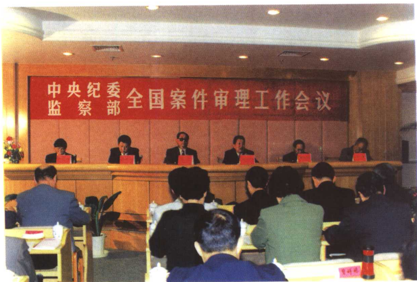
中央纪委、监察部全国案件审理工作会议会场