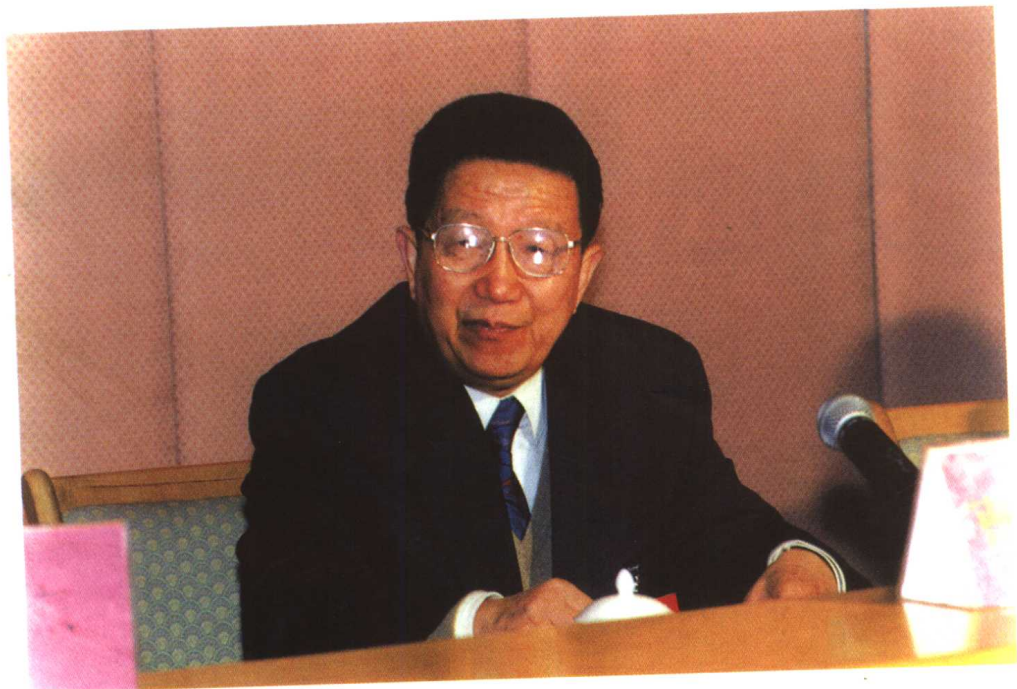
中央纪委副书记曹庆泽同志出席全国案件 审理工作会议并作重要讲话