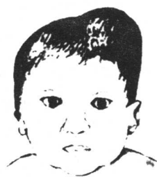
图 1-1 偏侧胎头水肿