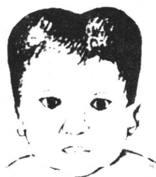
图 1-2 两侧胎头血肿瘤