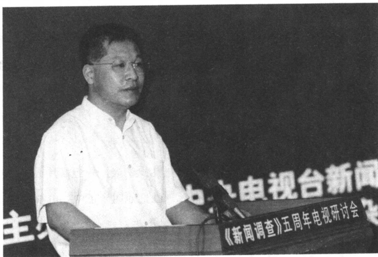
中央电视台副总编孙玉胜在《新闻调查》开播五周年研讨会上发言

上世纪90年代以来，中国电视媒体的发展呈现出三大趋势，对此专家用三个走向进行了概括：走向娱乐、走向财经和走向调查。而“走向调查”则是以1996年5月17日中央电视台《新闻调查》的创办为标志的。