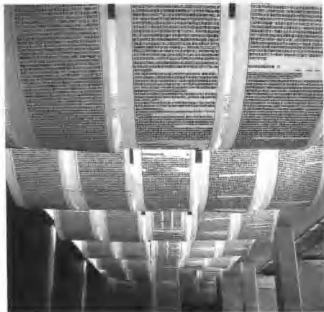
《新世界》 版画家 徐冰 1996