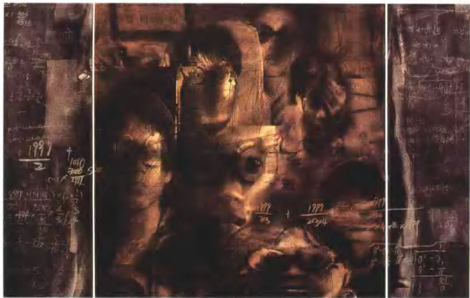
《视力的危机》 铜板 82 × 50cm 张凌 2004