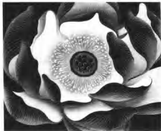
《荷之十》 木版 陈冰 1985年

首先在全球化语境中,中国当代版画的发展不可能脱离世界艺术的背景,它需要从中外艺术交流中充分吸取世界各国各民族优秀而有价值的因素以促进其自身的发展。但由于它的生存基础是当代中国艺术的现实土壤,因此它的发展也不能脱离当代中国的历史传统与现实背景。如多年置身于西方文化语境中的徐冰,早在1980年就已经意识到本土化的问题,尽管当时的学术界还很少这方面的研究,但他已经提出:“我更多地是从东方艺术的角度去考虑版画的某些问题的……总之木刻艺术中的许多现象都能在东方艺术的美学观念中找到契合关系,这并非把创作版画拉回到陈旧形式中去,而是因为中国传统美学观念看上去古老陈旧,但它有许多见解却是触及到了艺术自身的规律。有些与西方现代艺术的追求相吻合,对我们来说不失启迪意义。” ③ 此后,徐冰对绘画的复数性进行了较为深入的探索,在一篇论文中他写到:“艺术中的复数现象无疑有着审美价值。在以往艺术里,千佛洞一整面墙壁上无数同样佛龛的重复排列,以翻模形式出现的同一图案的汉代画像砖在建筑上的铺陈,这些虽未必是有意识的结果,但显然是被作为一种蕴含意义的视觉效果而产生的。” ④ 徐冰把版画的复数性和印痕结合起来,以图在重复的工作中展示不重复的艺术形象。他的作品《木刻第二系列》就是充分利用版画的复数性表现画家对“现时”的关注态度,从一个全新的角度开掘了本土文化的资源。而后创作的版画装置作品《析世鉴》更是从中国文化的源头获得灵感,从传