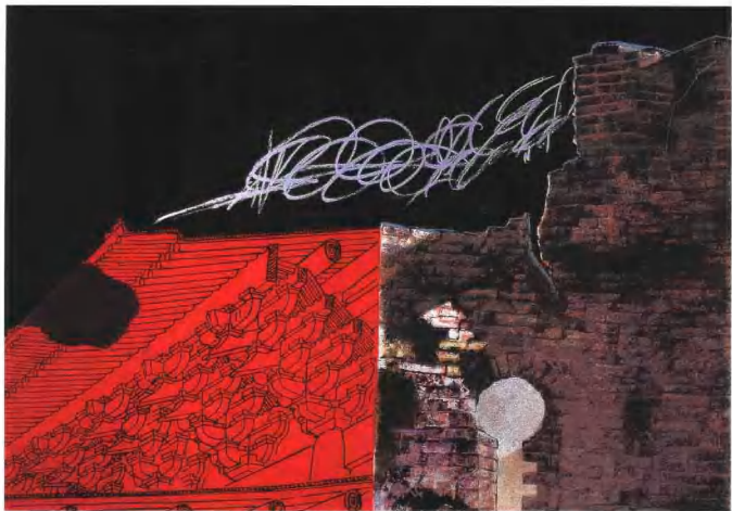
《墙系列组画之十》 丝网 45 × 66cm 张桂林 1994