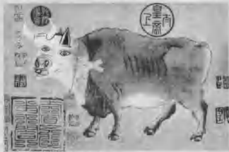
《五牛图》(No. 1) 30cm x 75cm 丝网 2005

困境,把自己的空间挤得非常小。假如我们更换一种展示方式,那么观众在进入展厅,摆弄这些展品的时候,就重新解读了你的作品,重新创造了你的作品,进入了作品的语境中,对作品也就产生了一种亲近感,有了一种接受的成功感,观众与作者的审美情趣在那一瞬间发生了直接的关联。丝网版画的优势是什么都可以印、可以印在任何地方,那么我们