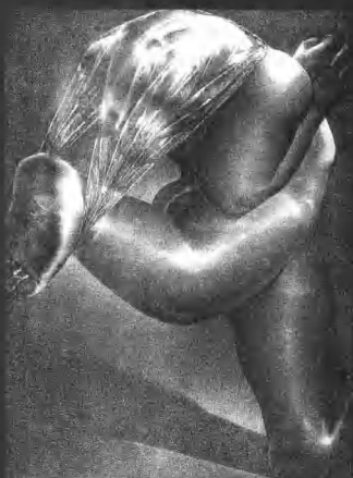
《疾走的夜》 石版 63 × 49cm 李凯亮 2002

与转换”为主题，目的是为了加强本次活动的有效性和问题的针对性，研讨会围绕在当代文化背景下版画创作与教学如何应对的问题，通过对版画艺术领域热点问题的讨论，寻求解决这些问题的方式方法，深入思考我国现代版画在继承和发展民族优秀文化和现实主义文化传统的基础上如何进一步开拓和创新。为此组委会特地邀请了一些在这方面具有较高研究水平的理论家一同参与，表达他们的学术观点和看法。因为版画艺术的发展与提高，除了艺术实践外，也需要学理上的深化和拓展。年会研讨会共分三部分，第一部分的议题是：版画与当代性；第二部分的议题是：版画的外延与内涵；第三部分的议题是：版画的实验教学。中国社会科学院哲学研究所研究员周国平以“尼采的艺术形而上学与艺术生理学”为题发言，他将创造力根源解释为不断创新、不怕毁灭的生命冲动。易英和殷双喜的发言则是从当代社会现象和艺术现象来分析版画教学和版画创作中所存在的问题。中央美术学院版画系教师王华祥和李帆从版画实践和教学的角度，更为具体地介绍了在新问题面前如何进行版画实验教学的问题。研讨会的议题：层层推进，环环相扣，做到了既有高度又有具体的解决问题的方式方法，得到了与会代表的普遍好评。在研讨会的自由发言中，为保障后勤而旁听的中央美术学院版画系三年级同学，对一些院校的某一具体课程的教学理念和创作动机提出了质疑，他们那种初生牛犊不怕虎的精神和