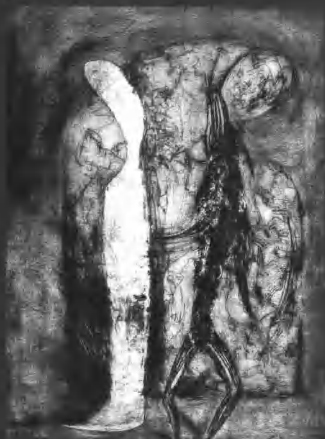
《个人屏障之二》 100 × 72cm 国彦 2004