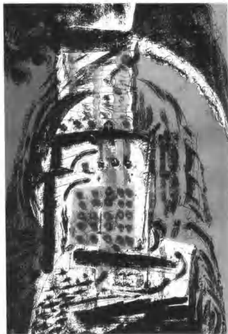
《空》 丝网 钟曦 1999

[2] 齐凤阁《重塑版画的当代品格》，《中国版画》第46期，人民美术出版社，2000年5月