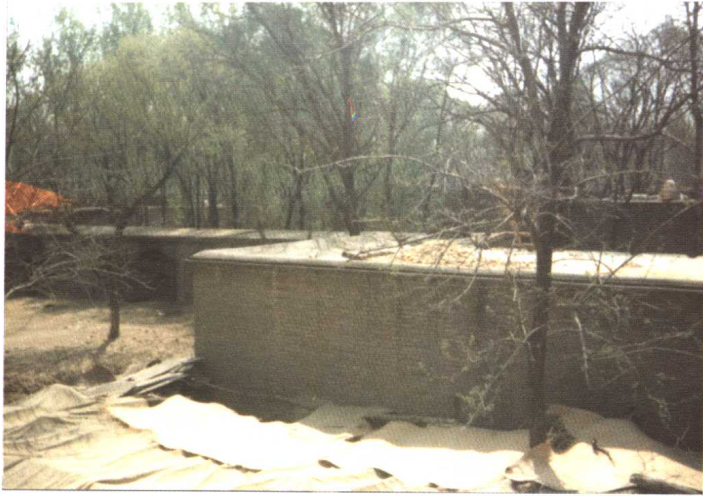
图5 韩祖庙对面的戏台原址，过去曾在这里唱秧歌戏。