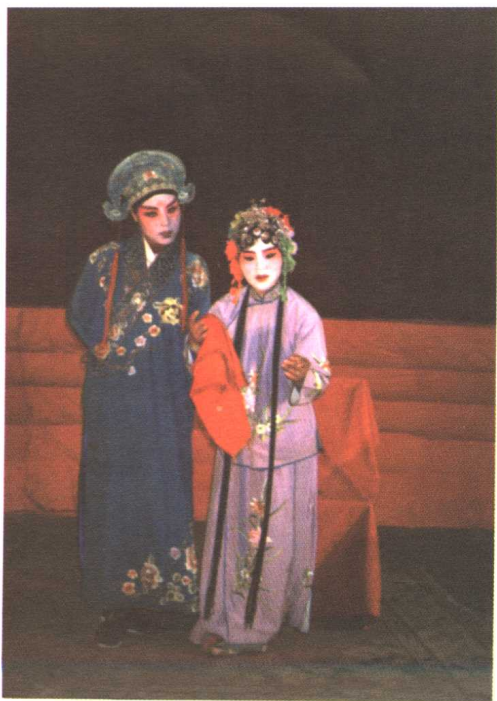
图12 定县秧歌《蓝桥会》剧照