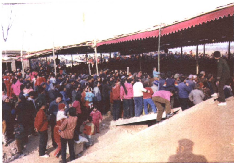
图7 90年代定县南陶邱庙会群众看秧歌戏《李香莲卖画》的热烈场面。