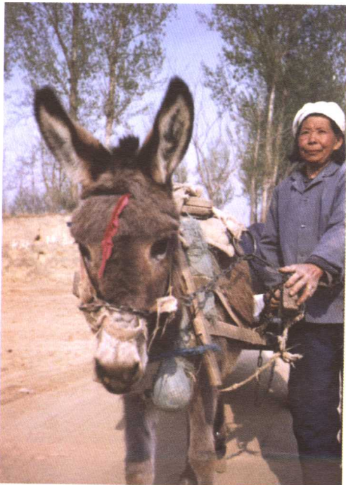
图6 赶着毛驴车到奶奶庙庙会看戏的农民，毛驴头上被系上了红绸带，以示喜庆。