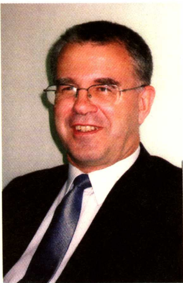
新西兰驻华大使 麦康年。

我与陈文照先生相识已有多多年，尤其是在他就任中国驻新西兰大使期间常有接触。陈大使不仅是他的国家的一位有才干的代表，也为理解新西兰花费了很多时间和精力，如同他在长期而丰富的职业生涯中去理解有幸生活过的其他国家和城市一样。陈大使最近写了本有关新西兰的书，被列入向中国读者介绍外国的国别系列丛