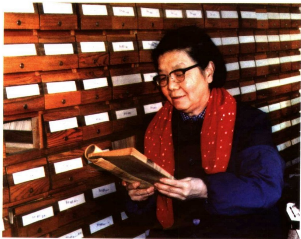
編纂《中國古籍善本書目錄》