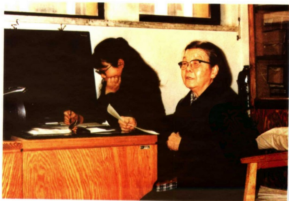
為善本組講授館藏源流