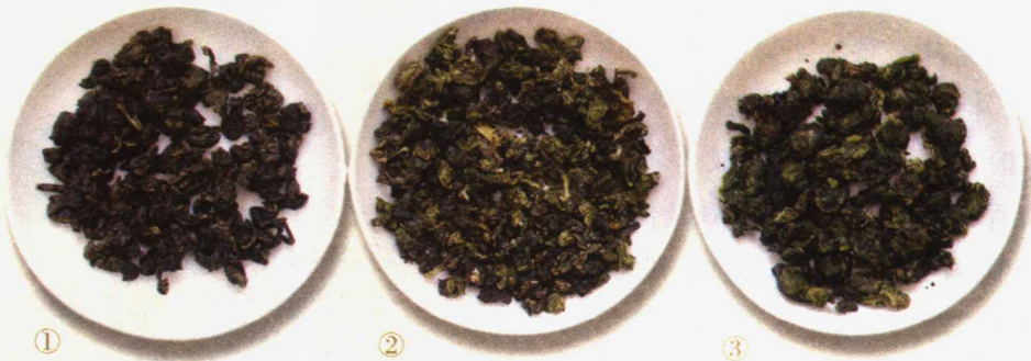
▷①白芽奇兰成品茶样；②毛蟹成品茶样；③永春佛手成品茶样。

永春县位于福建省东南部，北宋时就出产茶叶。佛手茶已有300年的栽培历史，相传为永春一寺院住持采集茶穗嫁接在佛手柑上所得。事实当