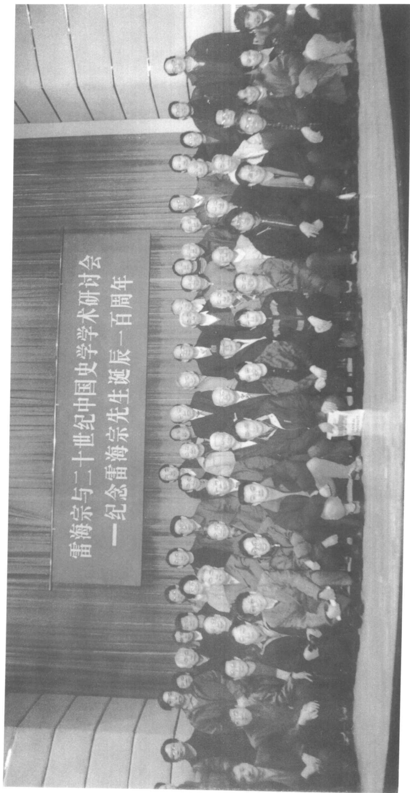
2002年12月15日“雷海宗与二十世纪中国史学术研讨会——纪念雷海宗先生诞辰一百周年”合影