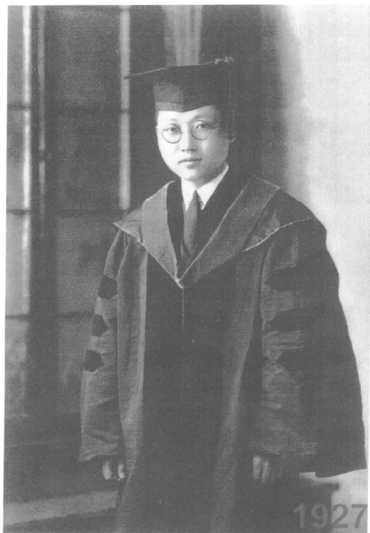
1927年在美国芝加哥大学获博士学位