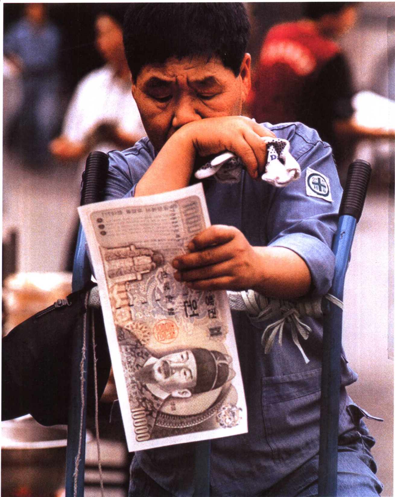
韩币与美元汇率跌至历史低点，工人为退休金而示威。这是示威活动中韩国铁路工人拿着面值1万韩元的纸钞，愁容满面。