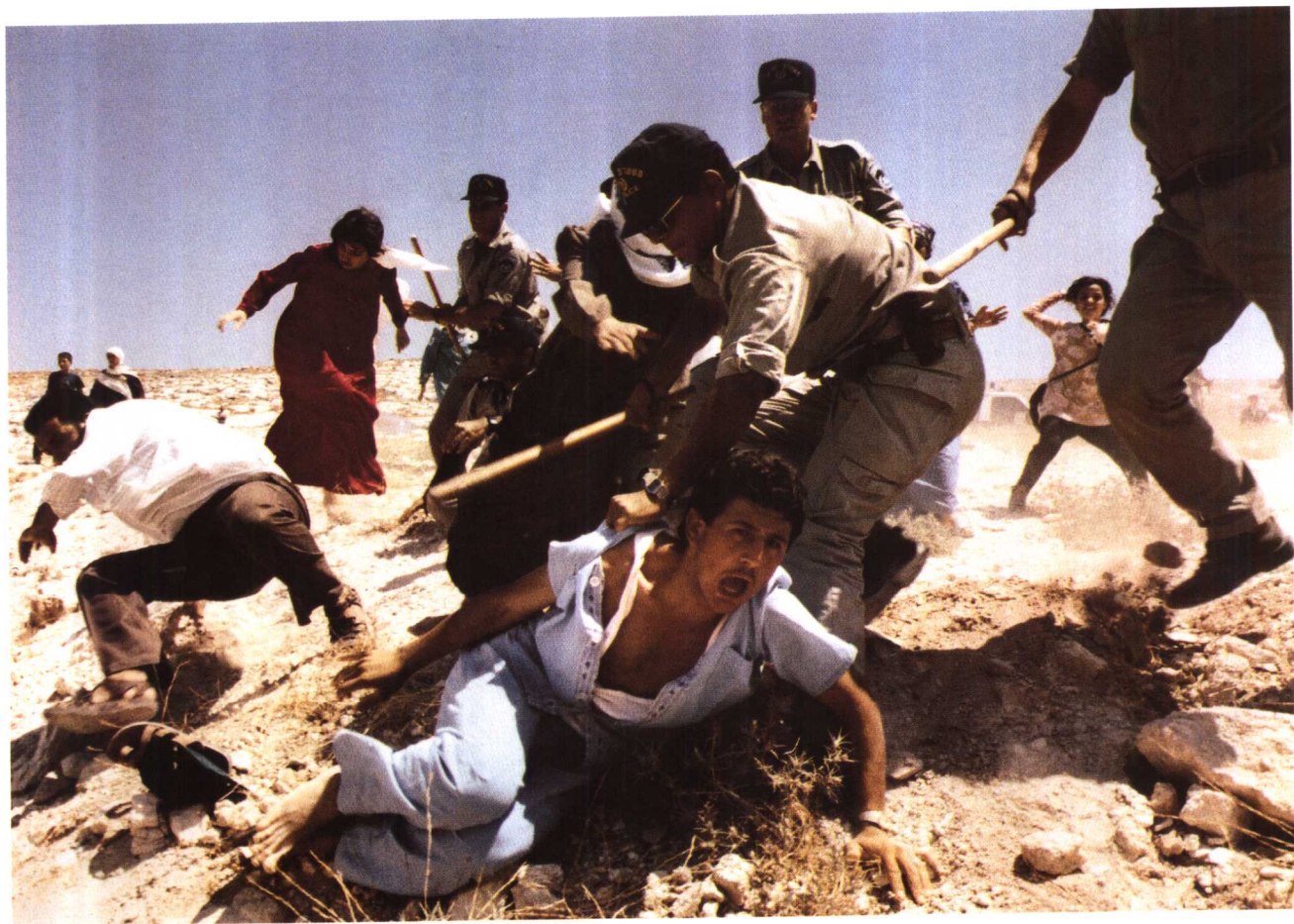
1993年8月26日，耶路撒冷东部村庄苏伯河一处被摧毁的非法定居点前，以色列防暴警察正用暴力驱赶巴勒斯坦抗议者。