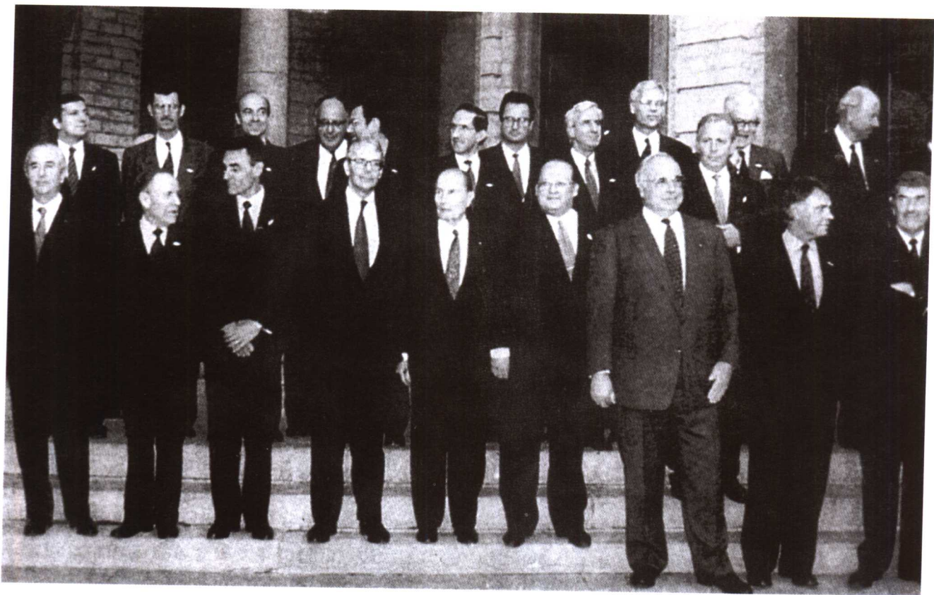
1993年11月1日，欧洲政治、经济一体化的《马斯特里赫特条约》开始生效，欧盟正式诞生。这是各参加国首脑合影。