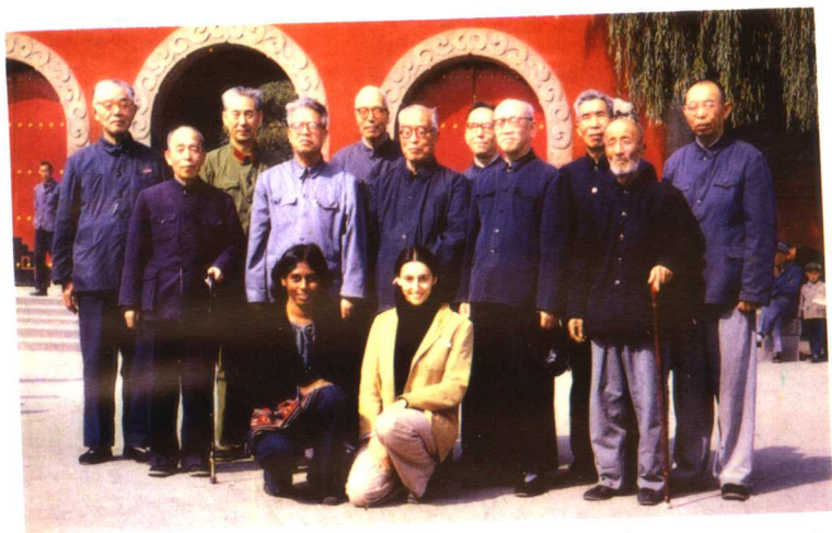
在“中国哲学史讨论会和中国哲学史学会成立大会”(太原,1979.10)上。站者左1 张岱年,左5 王明,左6 冯友兰,左7 任继愈,左9 冯契。