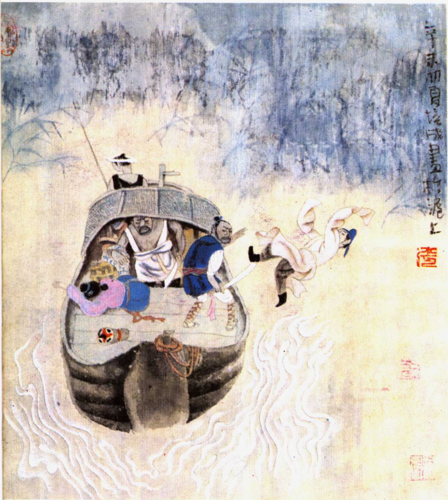
芙 蓉 屏