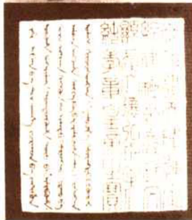
▲清世祖章皇帝之宝