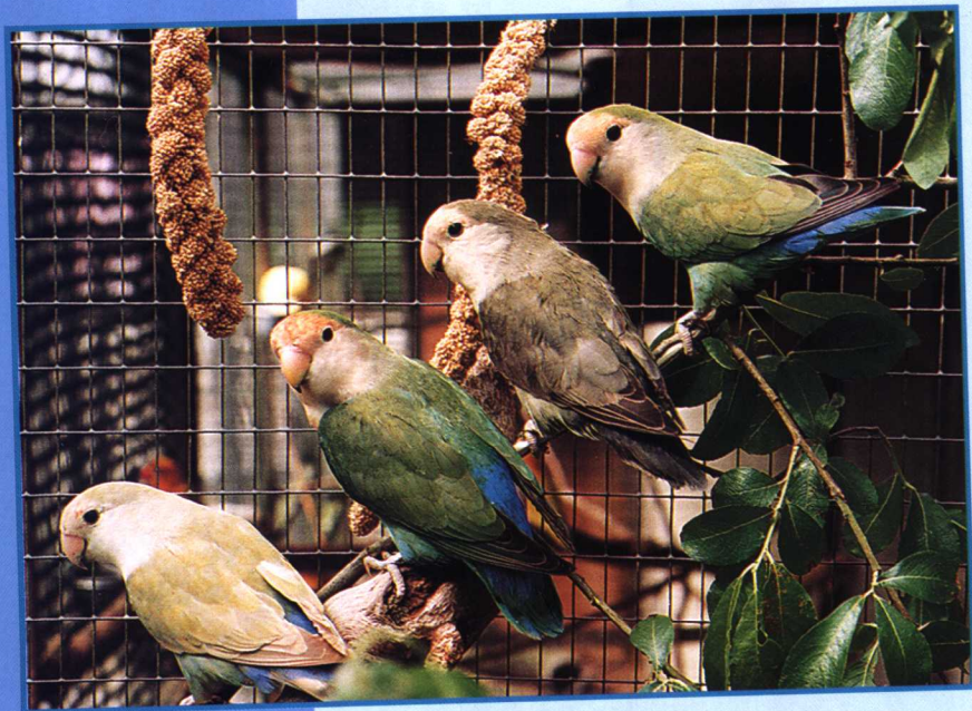
牡丹鸚鵡喜爱群居。

买牡丹鸚鵡一定要购买人工饲养的幼鸟。这样它们会习惯于管理，并变得自信和友善。牡丹鸚鵡的外观很美，但是您如果饲养的目的是训练它们说话，那么就不要选择牡丹鸚鵡了。