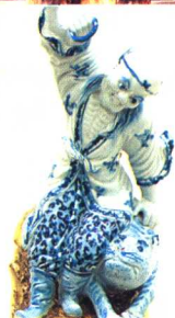
1 楠木雕土地像 (山东聊城) 2 金漆木雕彩绘“送子观音”菩萨像 (山西) 3 彩塑刘海像 (江苏无锡) 4 龙眼木雕寿星 (福建) 5 彩塑玉皇大帝 6 木雕吕洞宾 (山西) 7 铸铜鎏金释迦牟尼诞生像 8 木雕佉族寨神 (云南西盟) 9 瓷塑十八罗汉之一 (江西景德镇)