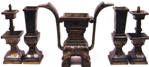
10 藏传佛教木版画双身金刚像 (四川德格) 11 版印纸马“天官赐福” (云南) 12 版印纸马“盪神” (云南) 13 扑灰画“赐福财神” (山东高密) 14 香炉 (山西运城) 15 象耳铜香炉 (山西) 16 金漆木雕孔子神位 (山东) 17 纸扎戏曲人物 (山东曹县) 18 五供香具烛台 (山西介休)