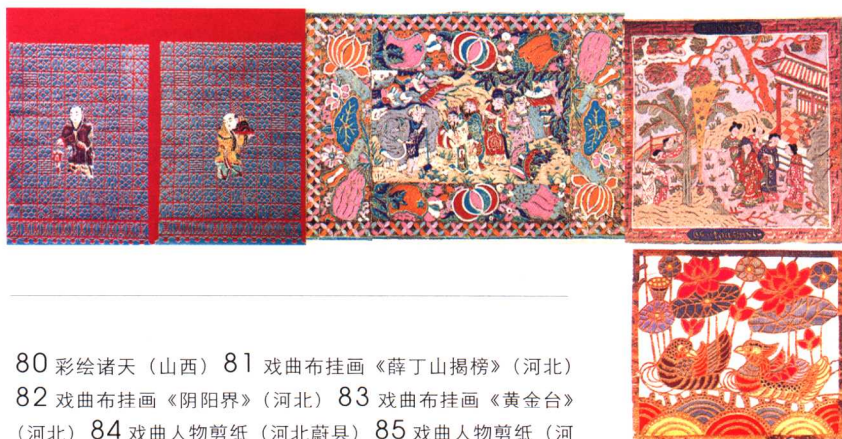
80 彩绘诸天 (山西) 81 戏曲布挂画《薛丁山揭榜》(河北) 82 戏曲布挂画《阴阳界》(河北) 83 戏曲布挂画《黄金台》 (河北) 84 戏曲人物剪纸(河北蔚县) 85 戏曲人物剪纸(河北蔚县) 86 剪纸“抓鸡娃娃”(山西吕梁) 87 木刻版画门笺(江苏南京) 88 木刻版画门笺(江苏南京) 89 剪纸“尧帝访贤”(广东佛山) 90 剪纸“焰火迎春”(广东佛山) 91 剪纸窗花“鸳鸯戏荷”(广东佛山)