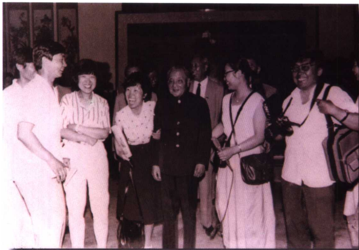
1989年11月13日，邓小平同志与记者在一起（左起第三人为国际台记者）。