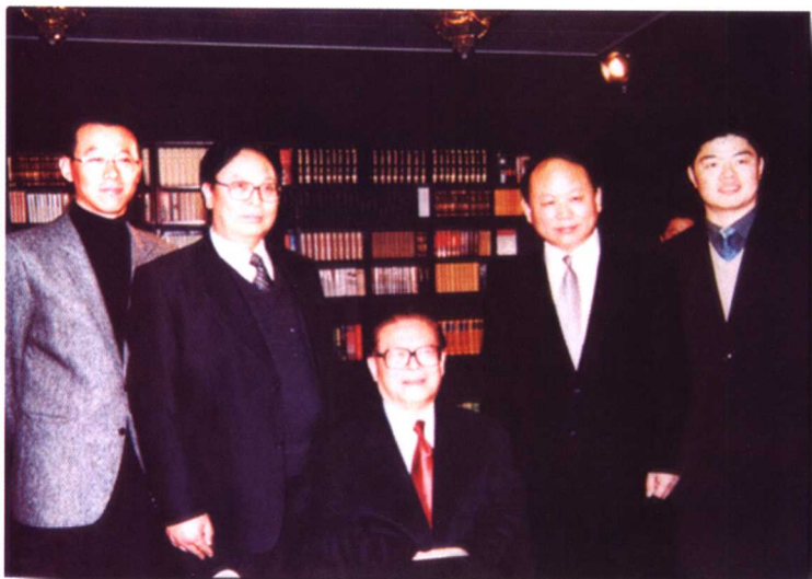
2000年12月31日，江泽民主席向海外听众、观众发表新年讲话，图为录音后与广电总局、国际台领导涂先春、李丹合影。