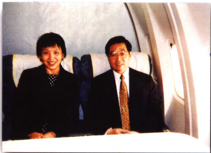
1998年4月，胡锦涛副主席出访日本、韩国，回国途中接受国际台记者采访并合影。