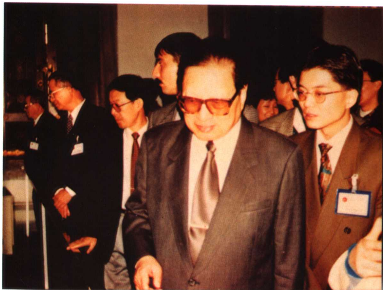
1996年11月乔石委员长访问土耳其时，国际台工作人员担任翻译。