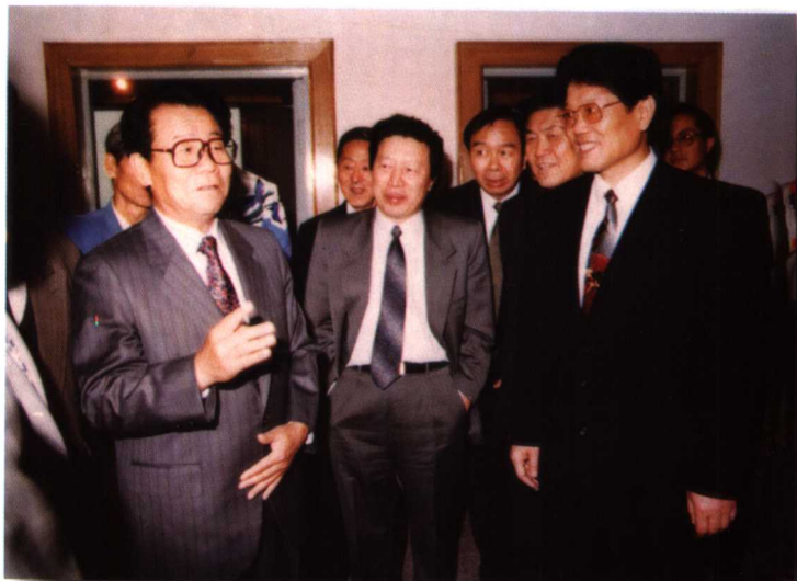
1995年10月12日，全国政协主席李瑞环和国务委员李铁映出席中国国际广播电台新大楼落成典礼并视察工作。广电部部长孙家正等陪同。