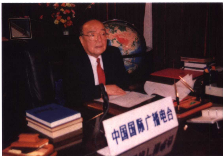
1992年12月31日，国家主席杨尚昆通过国际台向各国听众发表新年讲话。