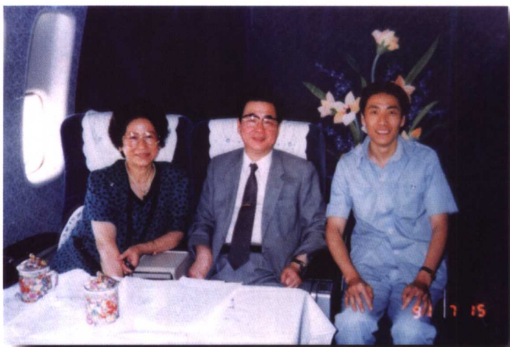
1991年李鹏总理出访非洲，国际台记者随团采访，在飞机上与李鹏总理及夫人合影。