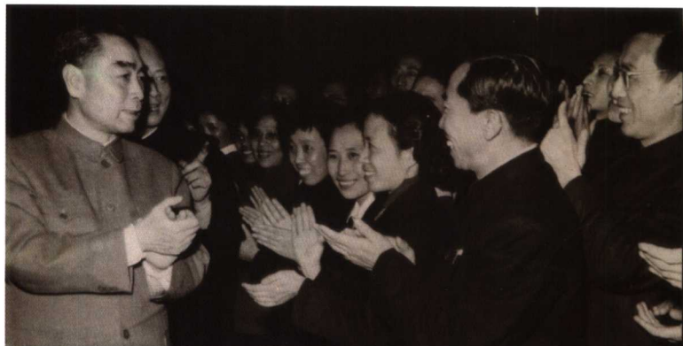
1960年，周恩来总理接见北京广播电台工作人员。