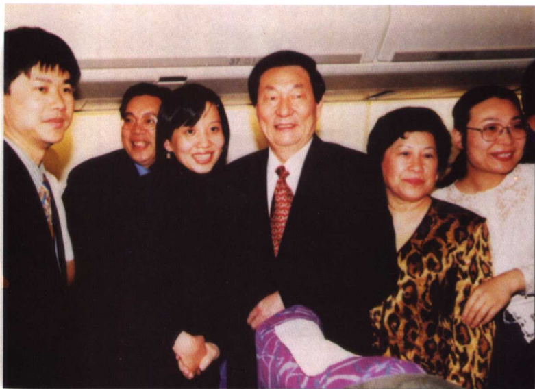
1999年4月，朱镕基总理出访美国，国际台记者随团采访。