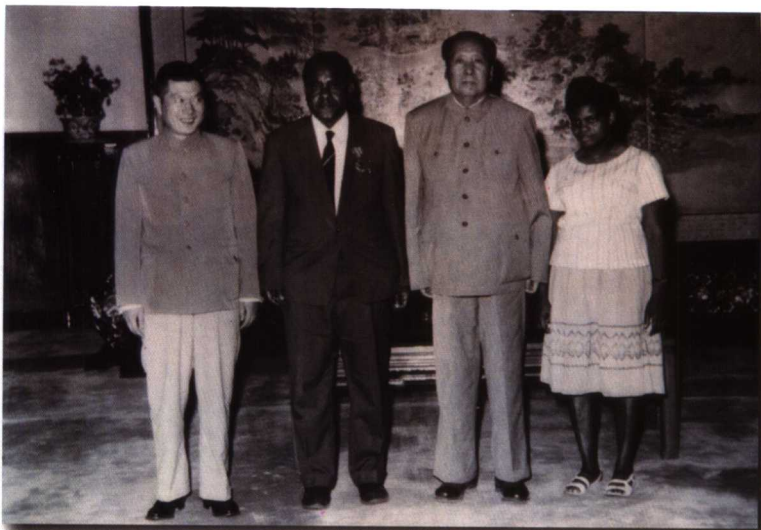
1964年6月18日，毛泽东主席接见北京广播电台斯瓦希里语专家阿里，国际台领导金照陪同接见。