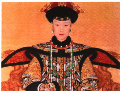
图7 慈禧佩戴翡翠的画面

翡翠的绿神秘深邃，高深莫测，含蓄庄重，纯洁柔和。它给人们一种欣欣向荣、和平宁静之感。它代表着一种向往，一种寄托，一种满足，一种自然之力而不可战胜。翡翠传入我国后，创造了更为完美的翡翠文化，使翡翠文化艺术在世界上发出最为灿烂的光彩。