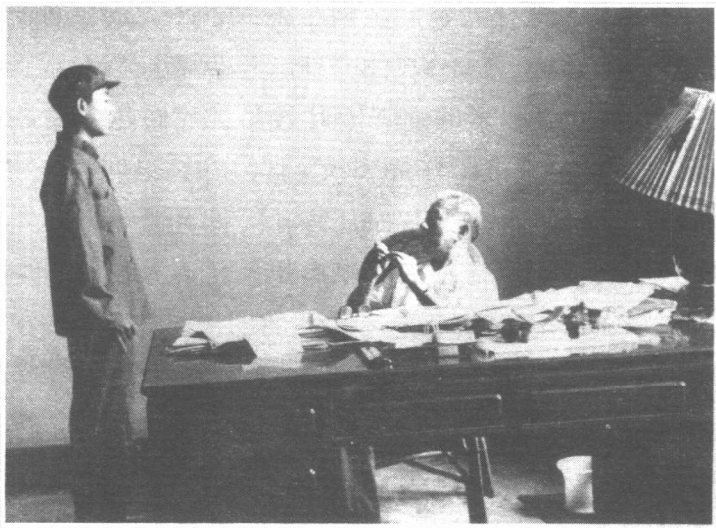
刘少奇听儿子刘源汇报当兵锻炼情况（1965年8月）。

“文化大革命”中，光杰在秦城监狱关了8年，在狱中写出了12本无线电方面的专业书。这些书后来陆陆续续都出版了。江泽民同志在电子工业部当部长时，本来光杰年纪比较大，要退下来，江泽民同志考虑他资历深，懂业务，特意保留他副部长职务并兼总工程师。