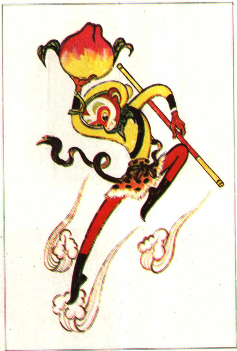
《大闹天官》中的孙悟空造型