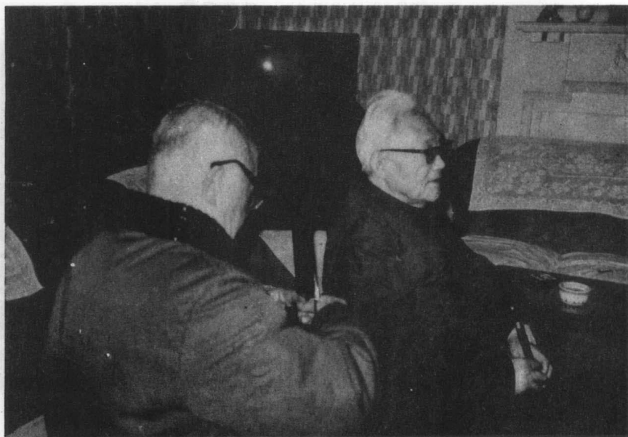
一九八五年万籁鸣为巴金剪影。