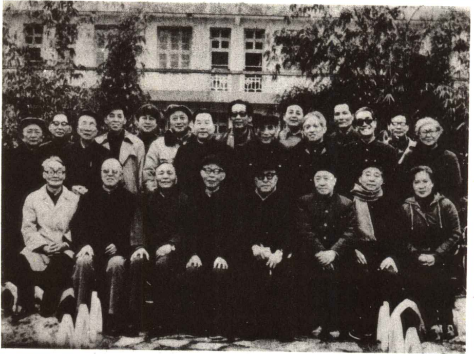
一九八二年万籁鸣作为“金鸡奖”的评委，在厦门鼓浪屿和电影界同行合影。