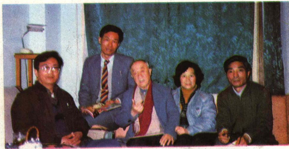
一九八六年春万籁鸣与本书作者、编者欢聚一堂。