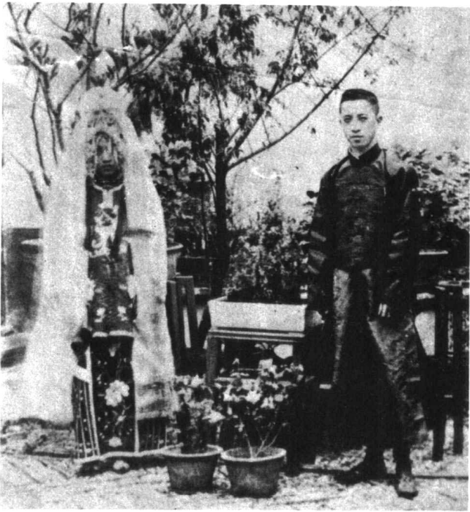
二年在南京结婚时留影。 万籁鸣与陈霭卿一九二