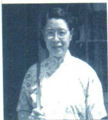
■ 年轻时的 严仁英

1935年，严仁英以第三名的成绩，从清华生物系考入北平协和医学院，师从著名妇产科专家林巧稚教授。经过五年的学习，1940年严仁英获得协和医学院医学博士学位，并被留在妇产科做了一名住院医师。然而作为林巧稚选定的接班人，年轻的严仁英也面临着一个两难的选择。