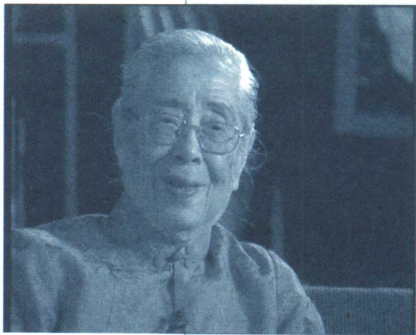
YAN REN YING

严仁英在妇产科、妇幼保健领域提出了很多新思想，不断借鉴国外的经验和技術，在国内率先开展了围产保健、优生优育服务和相关研究工作，并开拓出临床与预防保健相结合的发展道路。20世纪80年代初，北京医科大学妇儿保健中心在她的努力下正式成立。该中心是全国在综合医院中最早成立的面向妇女儿童群体健康保健的特殊机构，二十多年来承担了多项妇幼保健领域的国家和国际组织合作研究项目，取得了令人瞩目的成绩。严仁英还是一位杰出的社会活动家，早在解放初期，她就参加了我国消灭性病和封闭妓院的工作。抗美援朝时期，她又赴朝参加调查美国细菌战的工作，以后多次作为我国杰出的妇女代表赴世界各地进行国际交流。在担任全国人大代表的25年期间，她多次在“人大”提出议案，反映百姓心声，并为母婴保健立法作出了一定贡献。