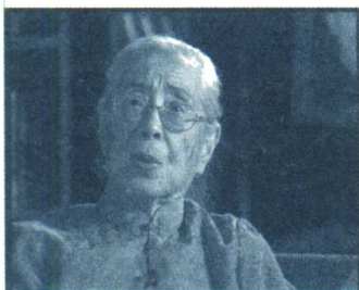
■ 严仁英接受《大家》栏目采访

1913年，严仁英出生于天津的一个名门望族。她的祖父是被称为“南开校父”的严修。这位清朝末年的翰林院编修在1906年创办了当时被誉为天津卫三宝之一的南开。周恩来在南开中学读书的时候，是严修非常欣赏的学生，正是他资助了周恩来出国留学。1929年严修病逝，《大公报》称誉他为“旧世纪的一代完人”。