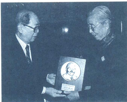
■ 1998年，严仁英获得首届中国内藤国际育儿奖

由于在妇幼保健工作方面的杰出贡献，严仁英被誉为“中国围产保健之母”。1988年获中国福利会妇幼保健樟树奖。1993年获首届中国人口奖。1998年，获中国内藤国际育儿奖。2000年被评为全国优秀儿童工作者。同时，她还主编了《妇产科学辞典》、《围产医学基础》、《妇女卫生保健学》、《实用优生学》和《实用优生手册》等著作。