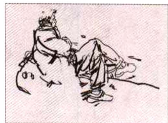
《男青年》，炭笔 / 图画纸，2004