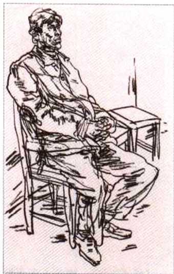
《中年人》，炭笔 / 素描纸，2004

在人物速写过程中，衣服衣纹褶皱让初学者觉得纷杂繁赘、环环相套、没完没了。你不能不画当然也不能全画。这要依据人体动态特征分清是“必然性”还是“偶然性”衣纹褶皱，从结构出发对衣纹进行概括与取舍，要主次分明，注重衣纹、虚实、松紧变化。简单讲，肢体弯曲的地方褶皱压的衣纹又多又密，可谓“必然性”，所呈现的衣纹状态是实、强、紧；肢体伸展的部分衣纹很少，这是由于身体内部结构关