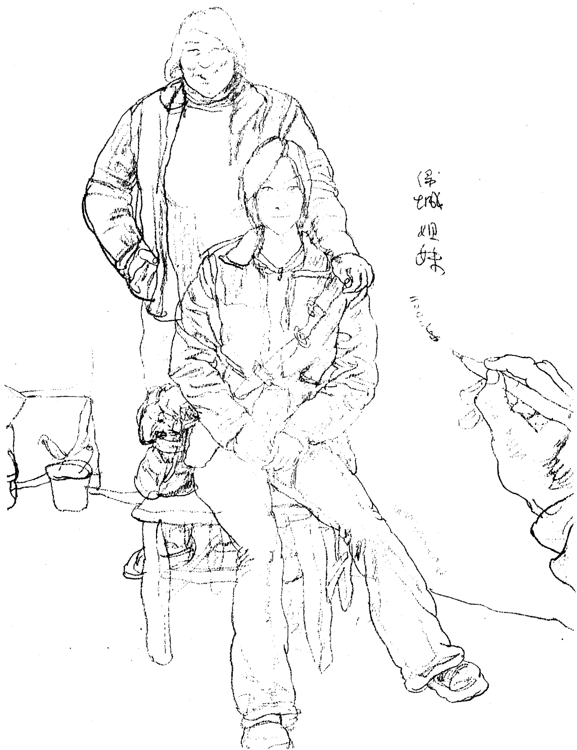
《绿城姐妹》，炭笔 / 图画纸，2002