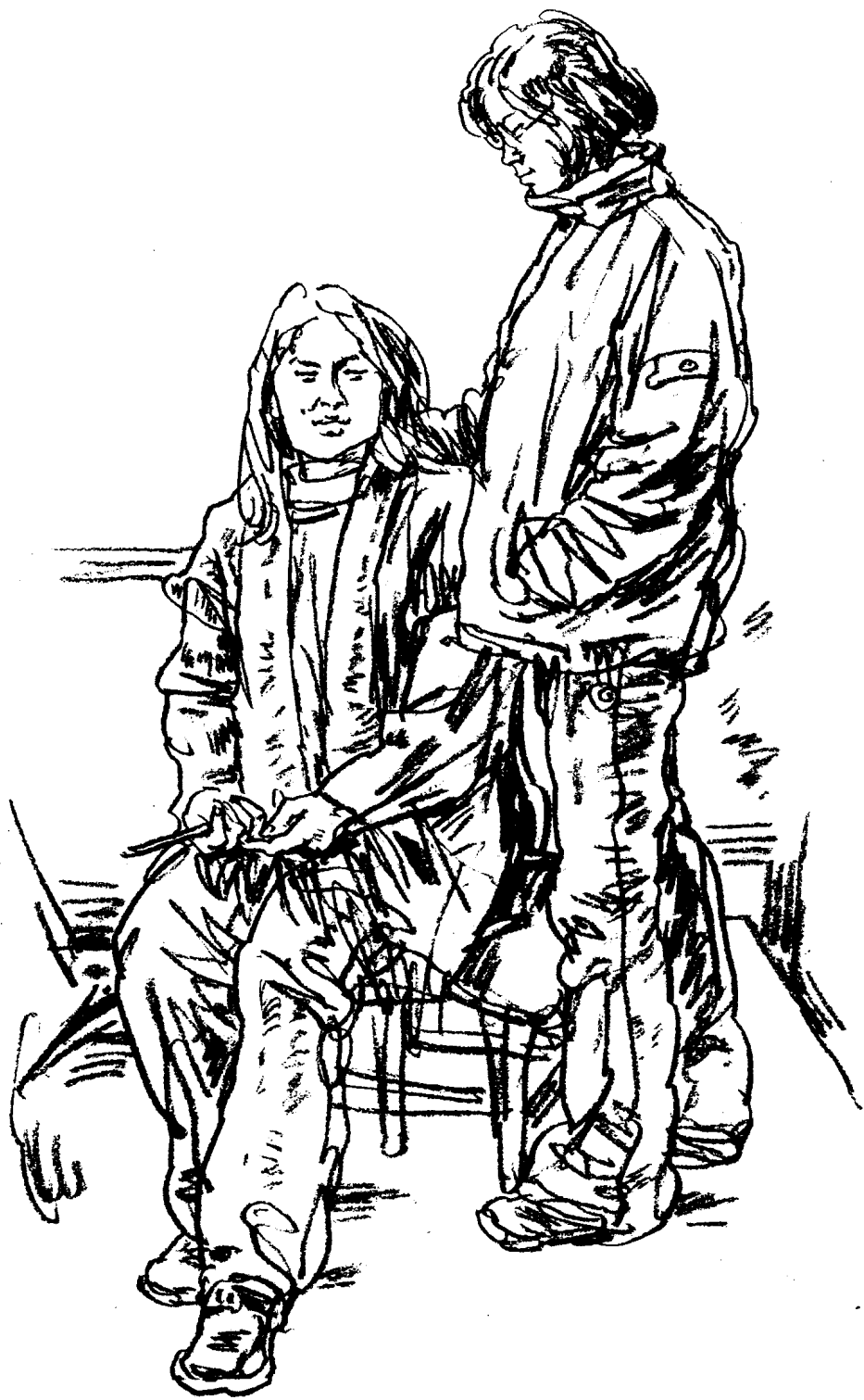
《女学生系列之二》，炭笔 / 素描纸，2004