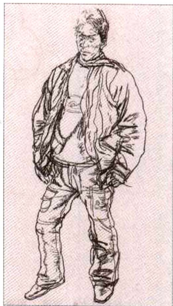
《伫立的青年》，炭笔 / 素描纸，2004