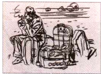
《等车的人》，炭笔 / 素描纸，2003

在人物速写实际训练过程中会遇到许多具体问题，诸如：手的表现、衣服及饰纹的取舍、人物表情的刻画、动作姿态的捕捉等等，而这些问题也正