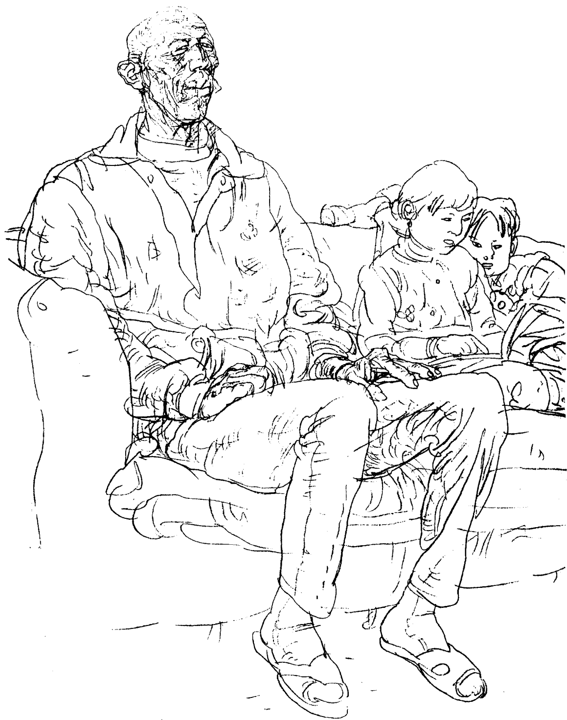
《大爷和孙女》，炭笔 / 图画纸，2004