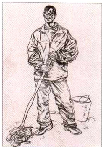
《手持拖把的男生》，炭笔 / 素描纸，2003

许多入门、技法书上都配有速写方法步骤图。想想看，速写如果限定了套路就失去了感觉；描绘若变成了机械的操作就毫无生动可言。艺术需有感而发，对初学者也一样。画前必得先有感受，这感受实际就是通过观看而产生的想法，再支配你怎样刻画，可以说怎样观看就怎样刻画。当然，你要拥有一双经过训练的眼。眼睛怎样训练？那就是对着“真人”放眼直看，多画、多想、多悟，先瞧老师怎样画，再看名家如何写。不要测量“三停五眼”和“几个头长”，更不要记背“几块骨头”和肌肉名称。我们画的大多是着衣的外表，即使脱去了衣服也看不到内部的肌肉骨骼，但内部的肌肉骨骼仍然隆起凸显在你的眼前。想深入了解人体，你可结合自己的身体，触摸观看：哪儿硬，哪儿软，哪儿曲，哪儿直，哪儿是可以活动的，哪儿是不能动弹的。致于比例，任何一个未经艺术训练的初学者看人的比例（如身材的高矮、胖瘦、以及身体各部位间的协调关系）都几乎有着天生的敏感。