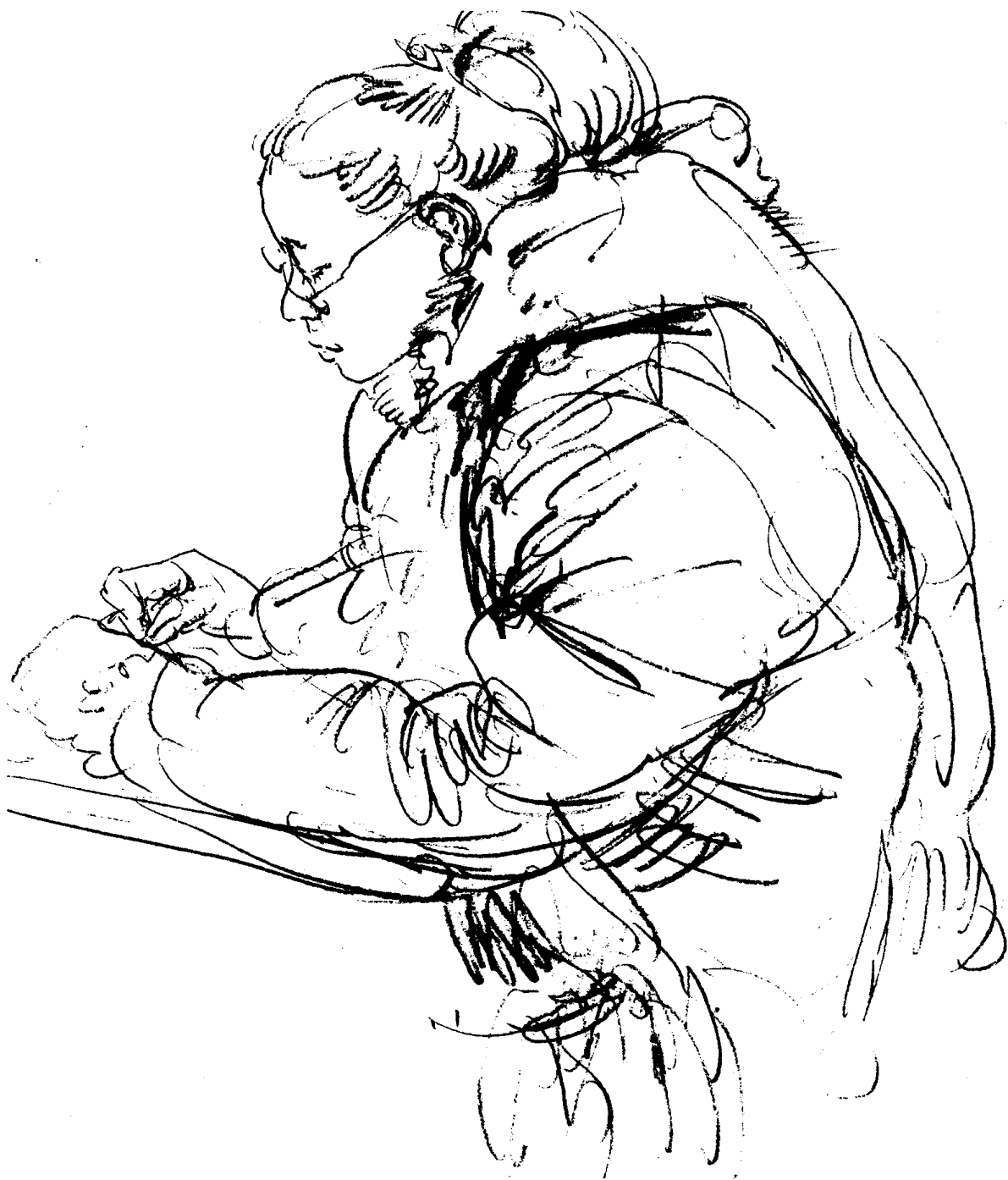
《作画的女学生》，炭笔 / 素描纸，2003