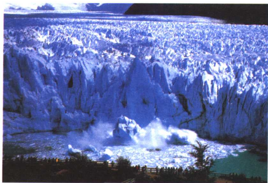
佩里托莫雷诺冰川