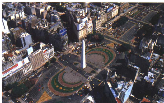
布宜诺斯艾利斯7·9大街共和国广场和纪念碑