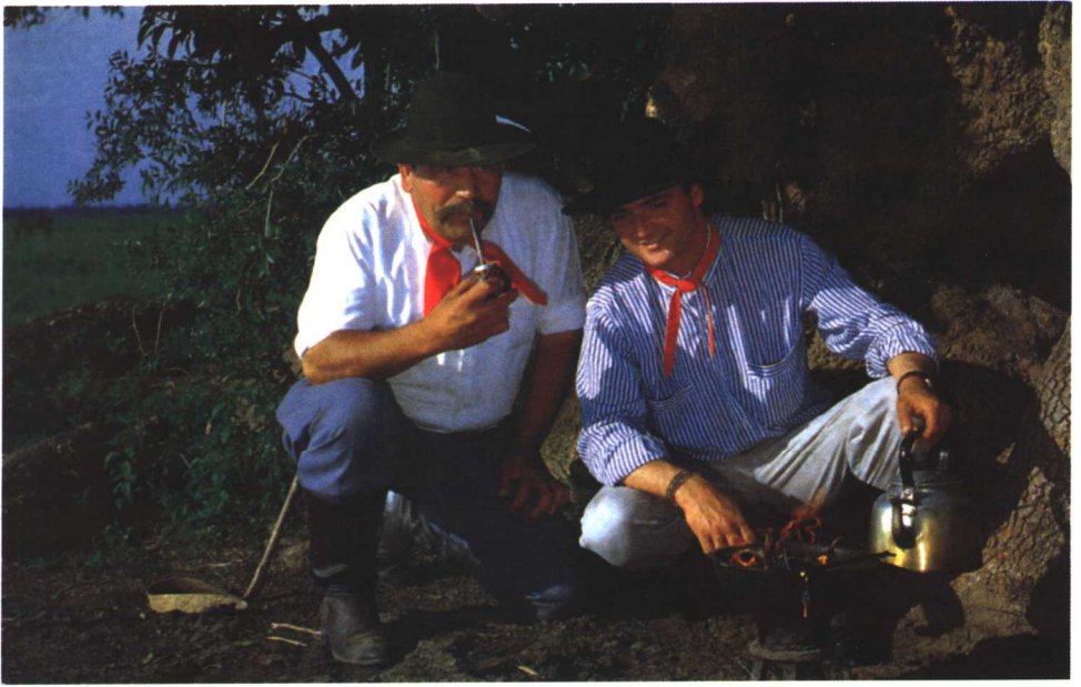
饮用马黛茶的高乔人