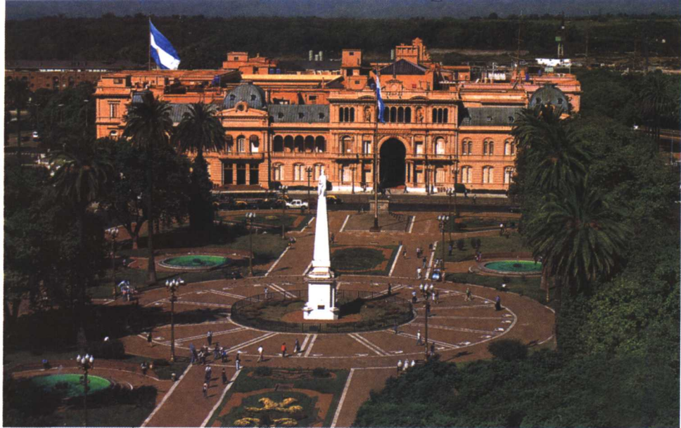
阿根廷总统府玫瑰宫