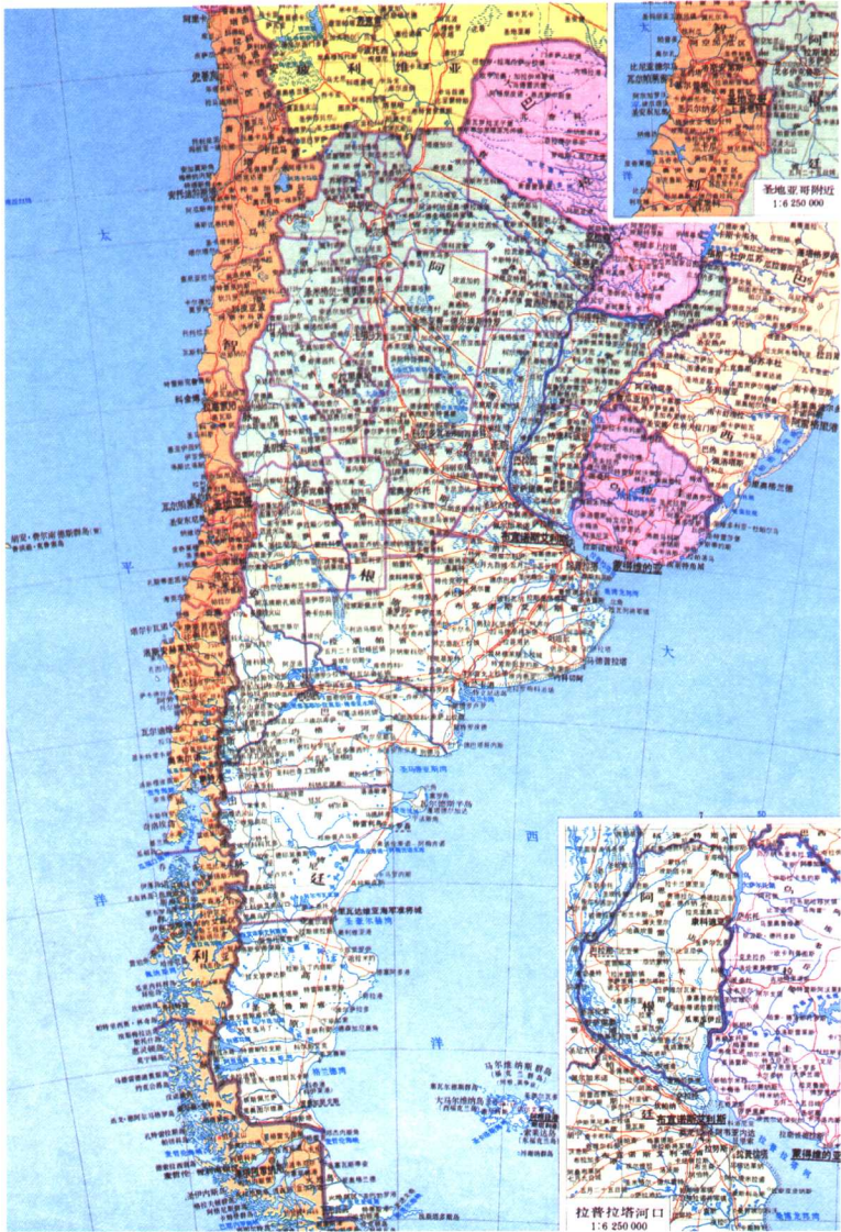
阿根廷行政区划图