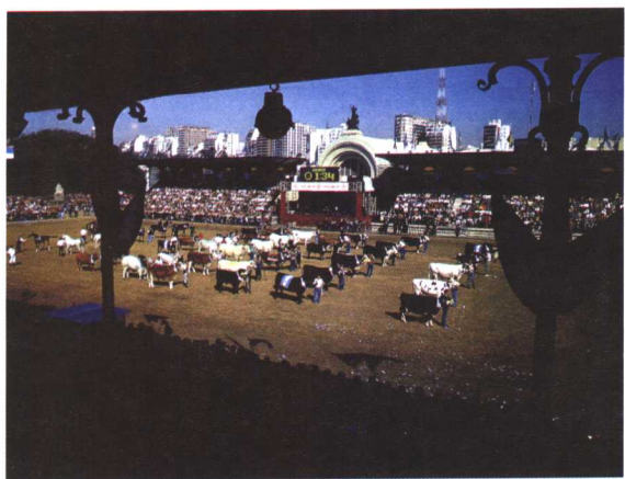
阿根廷牧业博览会