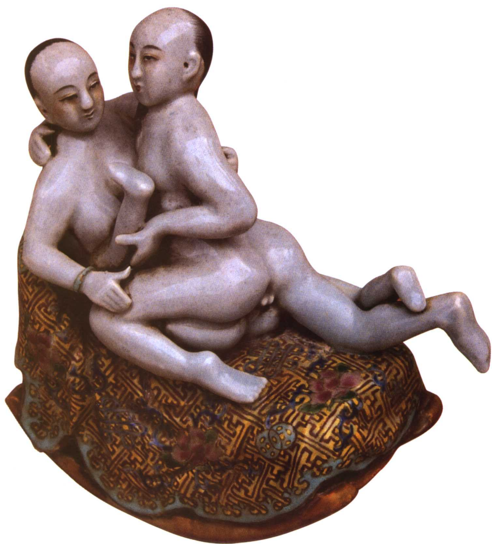
瓷雕：男欢女爱(近代)