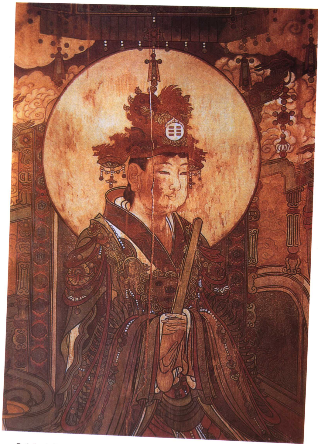
西王母。古代传说中中华民族的女始祖，“蓬发善啸”，实际上她可能是一位母系氏族的首领。