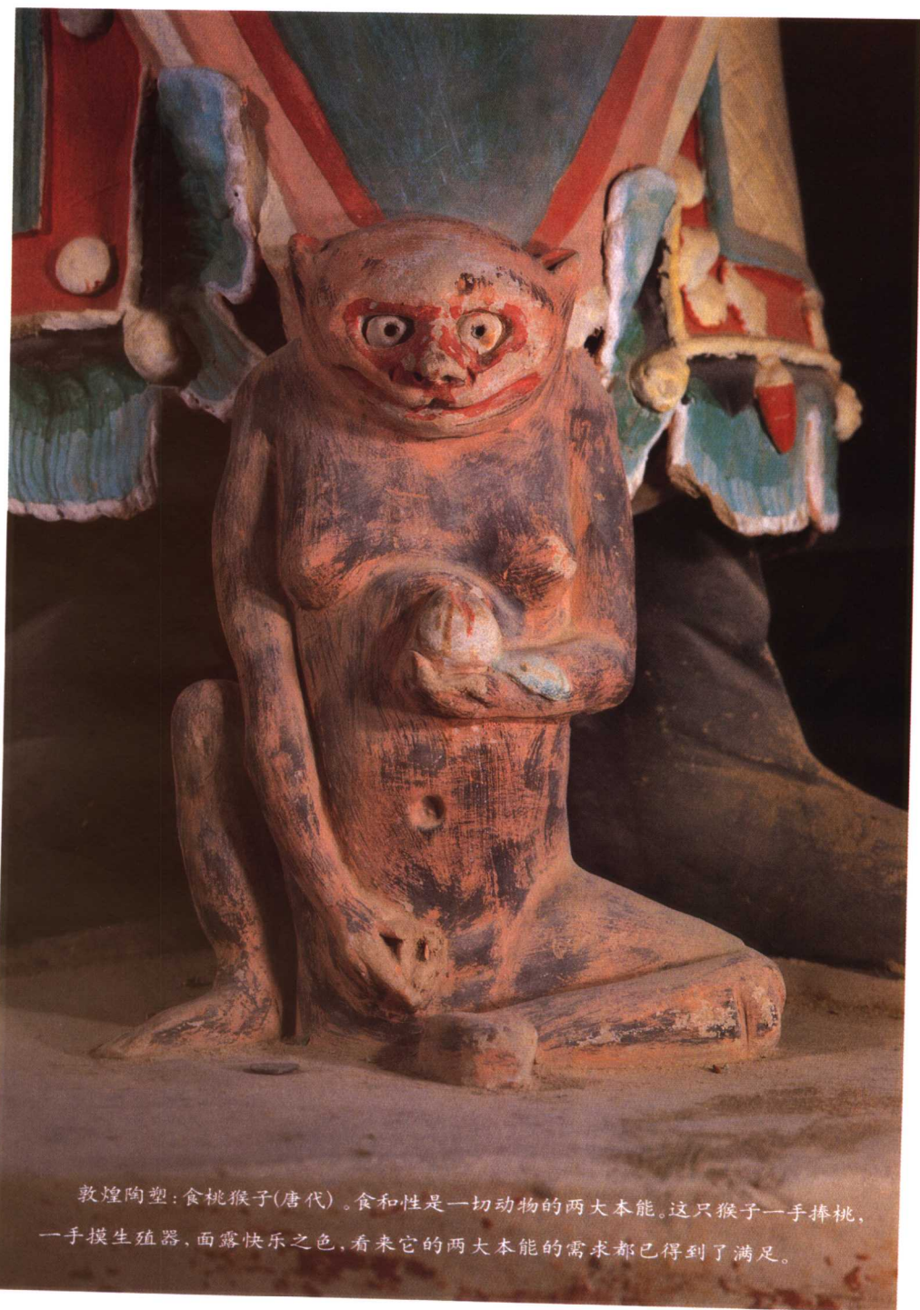
敦煌陶塑：食桃猴子(唐代)。食和性是一切动物的两大本能。这只猴子一手捧桃，一手摸生殖器，面露快乐之色，看来它的两大本能的需求都已得到了满足。