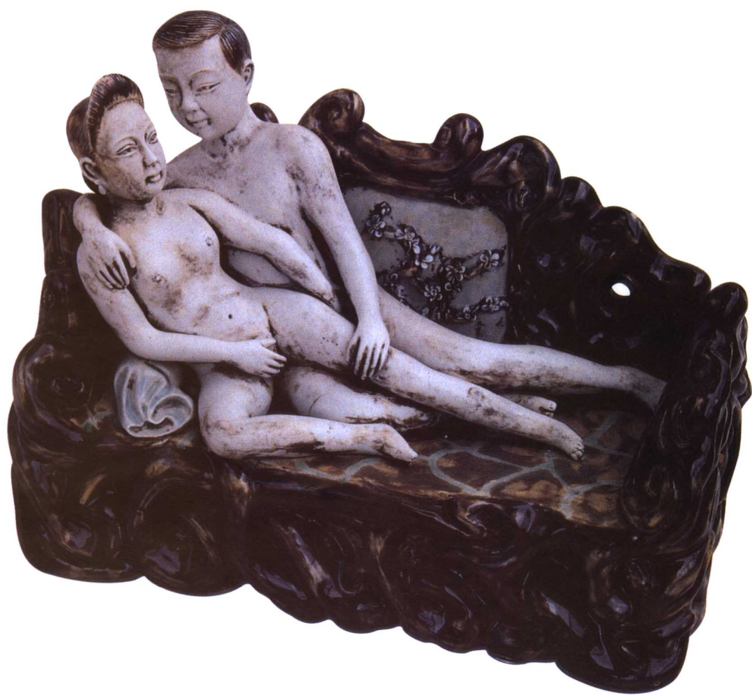
瓷雕：男欢女爱(近代)