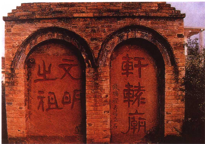
轩辕庙。黄帝是传说中中华民族的祖先，也是一位房中术专家。古代有“黄帝御千二百女而成仙”之说。

鼓励，对性的控制相对宽松；如果由于人口太多，就会对性与生育严格控制，在性的方式方法问题上加强引导。性又紧密关联着人们的自由和幸福，当人性被压抑而得不到这种自由和幸福时就会奋起抗争，甚至付出生命的代价；当人们享有自由和幸福，其中也包括性的自由和幸福时，积极性就会大为提高，社会也会加速发展。人类最基本的生活需要是物质生活需要和性的需要，至于精神生活需要则是进一步的高层次需要了。人们生存的最基本的需要是物质与性，人们享受的最基本出发点也是物质与性。