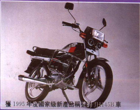
獲 1995 年度國家級新產品稱號的 JH145B 車

左右，目前已形成年產摩托車 120 萬輛、獵槍彈 1500 萬發以上的生產能力。1994 年，產銷摩托車 85.5 萬輛，主營業務收入 402393 萬元，利稅總額 88200 萬元，稅後利潤 27976.32 萬元，每股稅後利潤 1.36 元。1995 年 1—6 月，利稅總額 56828 萬元，稅後利潤 14936.84 萬元，每股