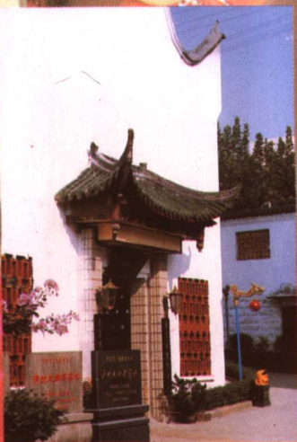
四百年老窖址（該窖池始建于 1573 年， 是全國釀酒行業唯一一處省級文物保護單位）