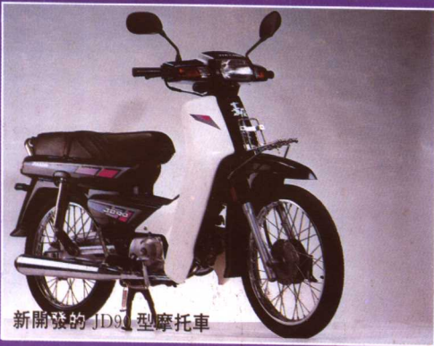
新開發的 JD91 型摩托車