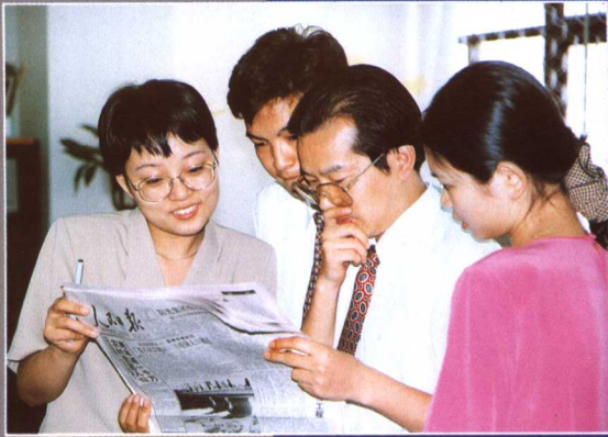
公司干部職工們研討業務