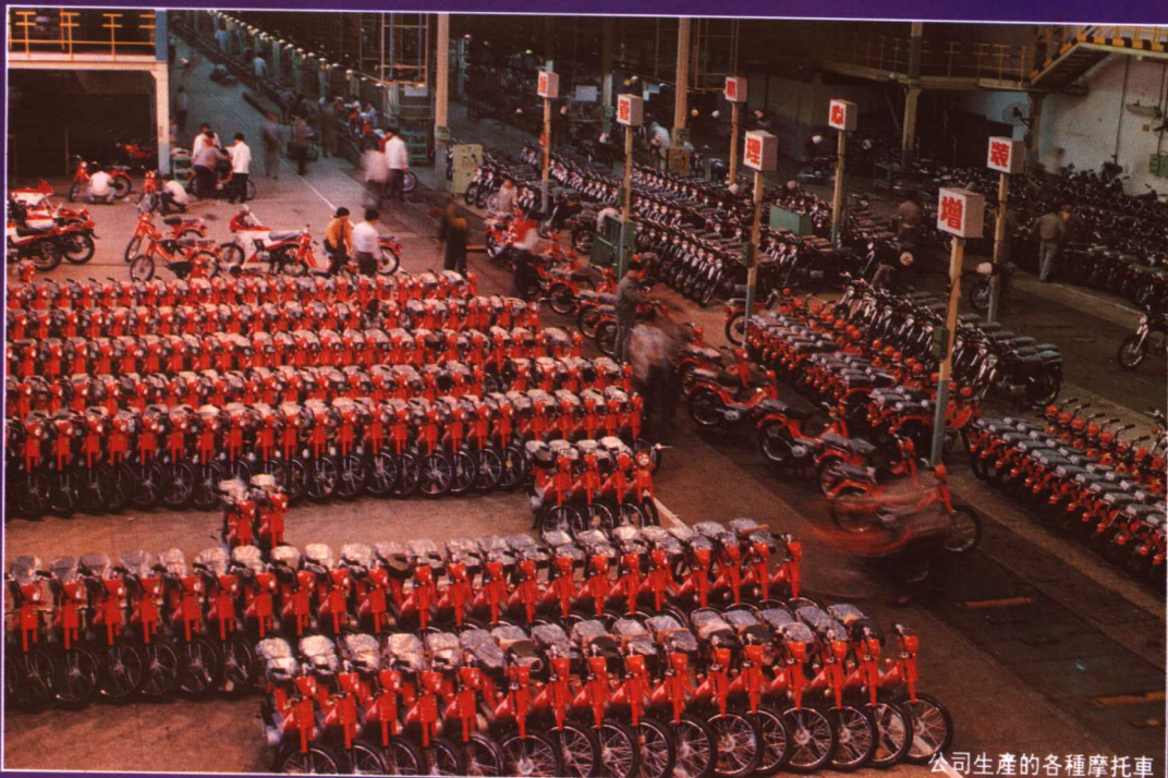
公司生產的各種摩托車