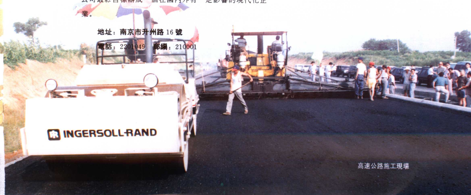
高速公路施工現場