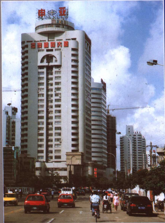
港澳證券辦公大樓外景