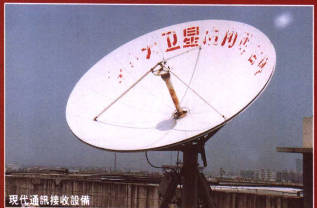
現代通訊接收設備