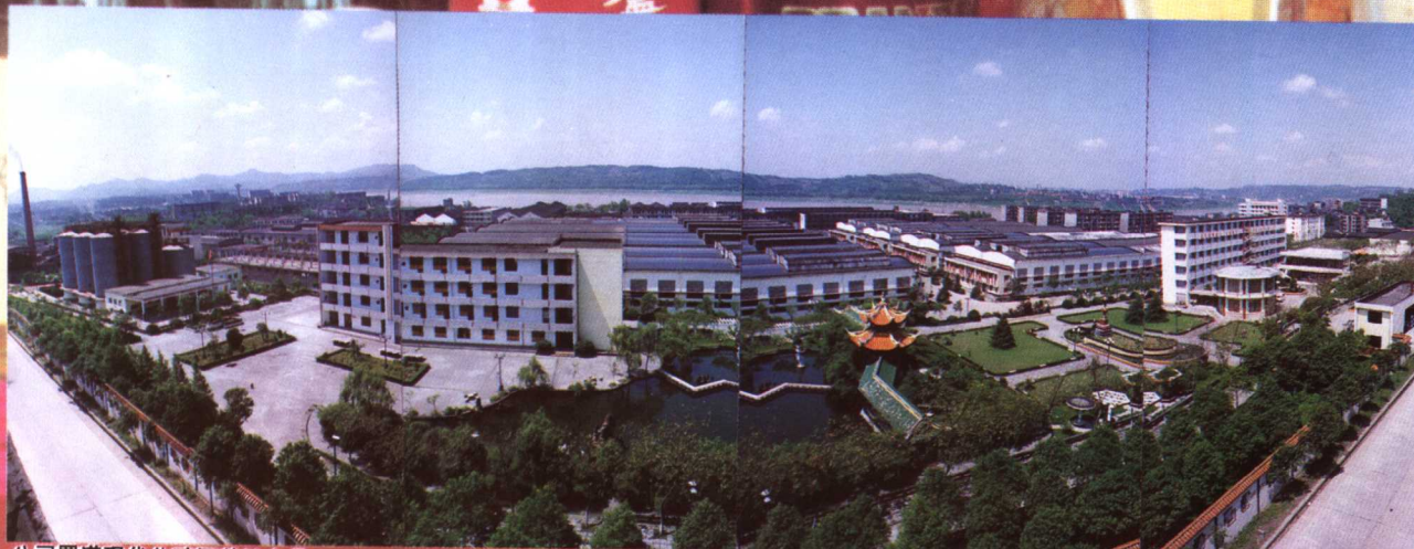
公司羅漢現代化釀酒基地全景