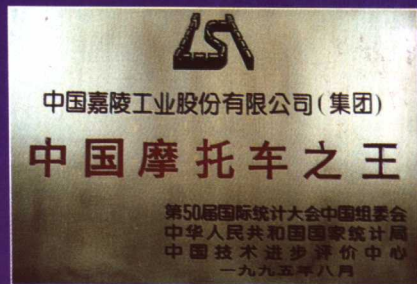
公司獲得的榮譽稱號