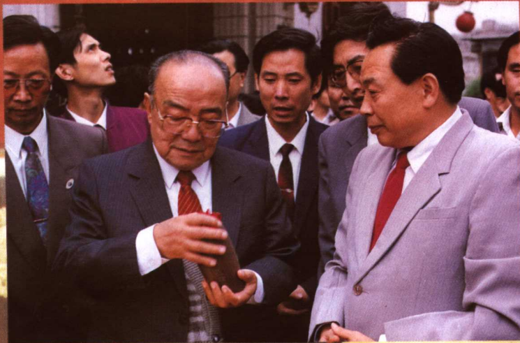
前國家主席楊尚昆先生在公司視察