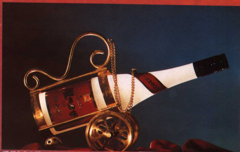
瀘州老窖金爵士豪華特曲酒