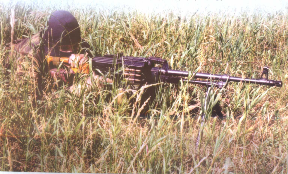
使用PK机枪的特种部队队员