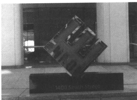
美国安然倒闭掀起轩然大波。

福利薪资，并认同工会组织的正面作用。他也是一位理想主义者，对企业组织有很高的期待，他主张国家与政府退位，认为企业是社会的公器，也是推动社会进步的最重要工具。但他晚年不幸看到 GM 的衰败，看到安然事件中经理人的欺骗行为，看到企业大幅亏损但 CEO 却坐领高薪等现象。这也促使他将更多精力投入在非营利事业管理的议题上，尤其着力于学校、医院、宗教等三类团体。