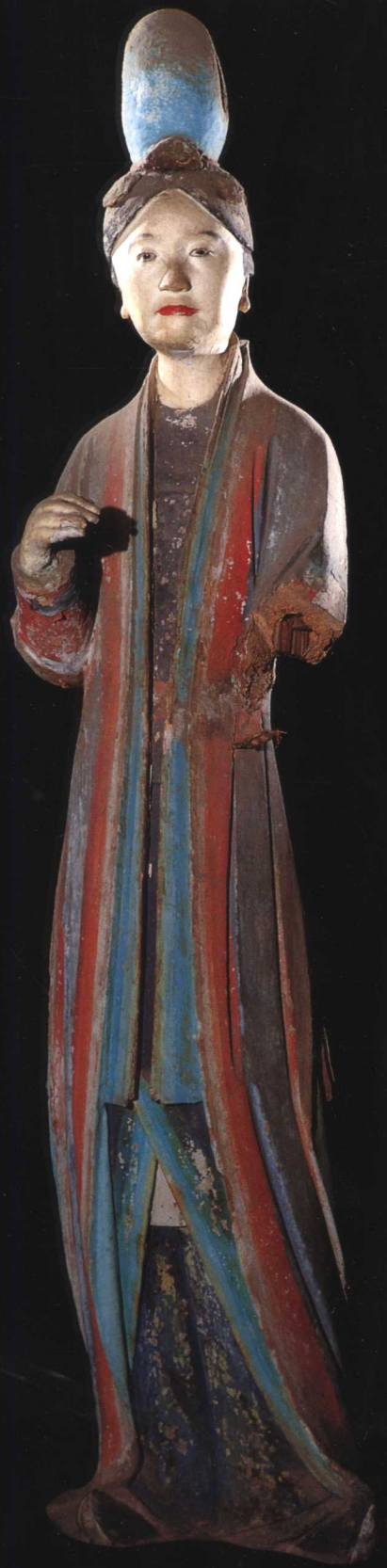
侍女 宋 晋祠圣母殿