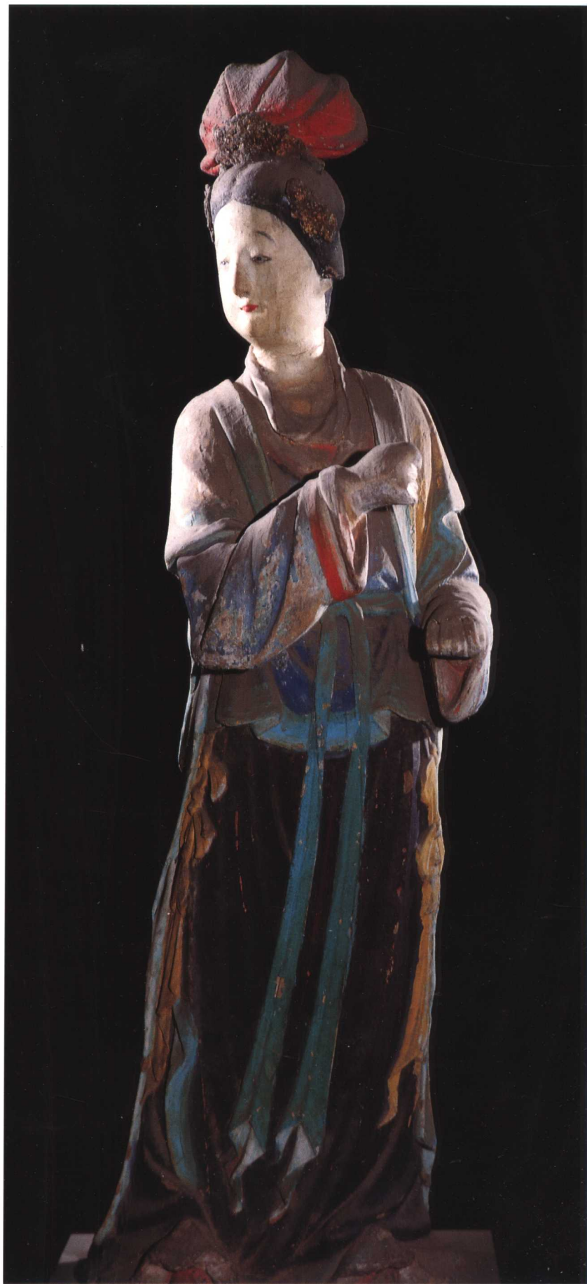
侍女 宋 晋祠圣母殿