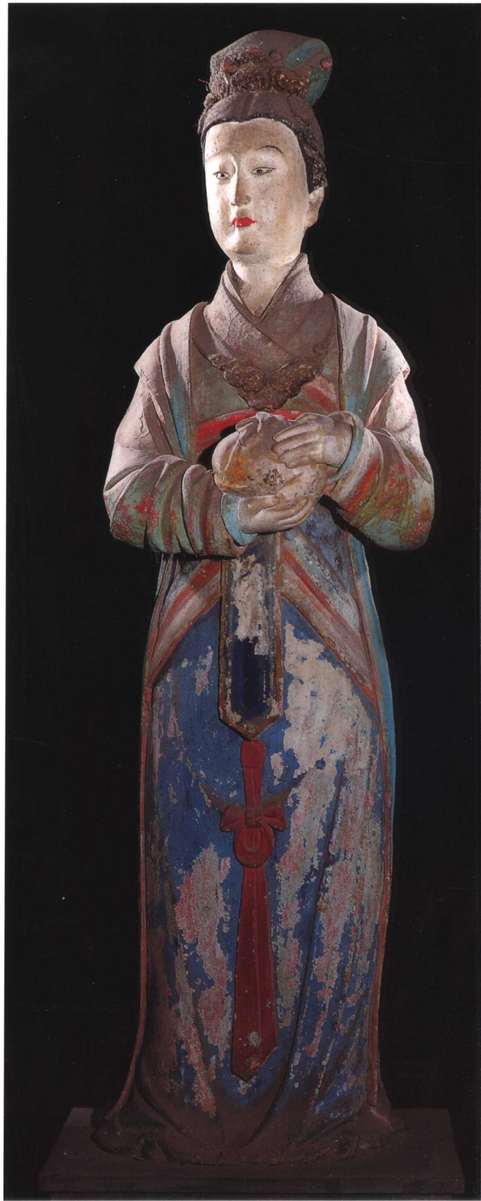
侍女 宋 晋祠圣母殿