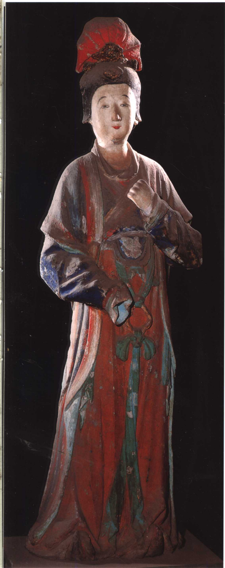
侍女 宋 晋祠圣母殿