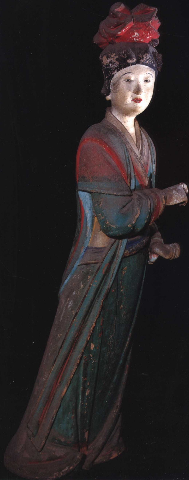
侍女 宋 晋祠圣母殿