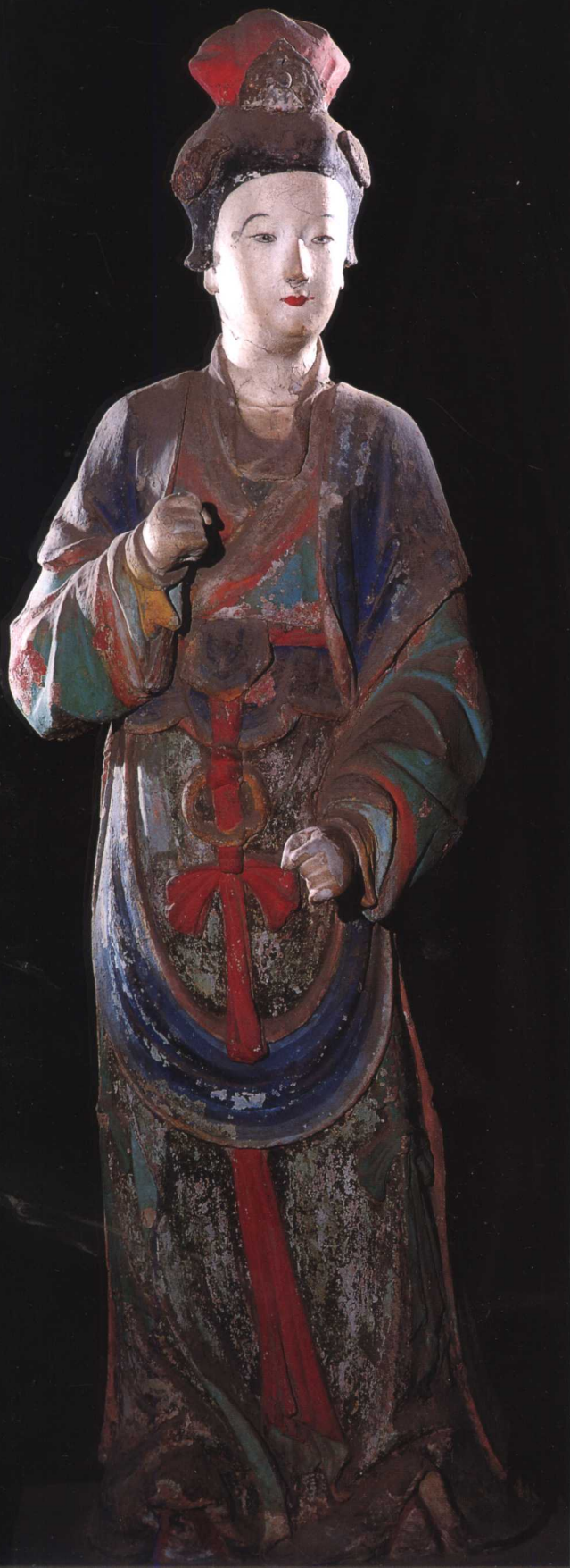
侍女 宋 晋祠圣母殿