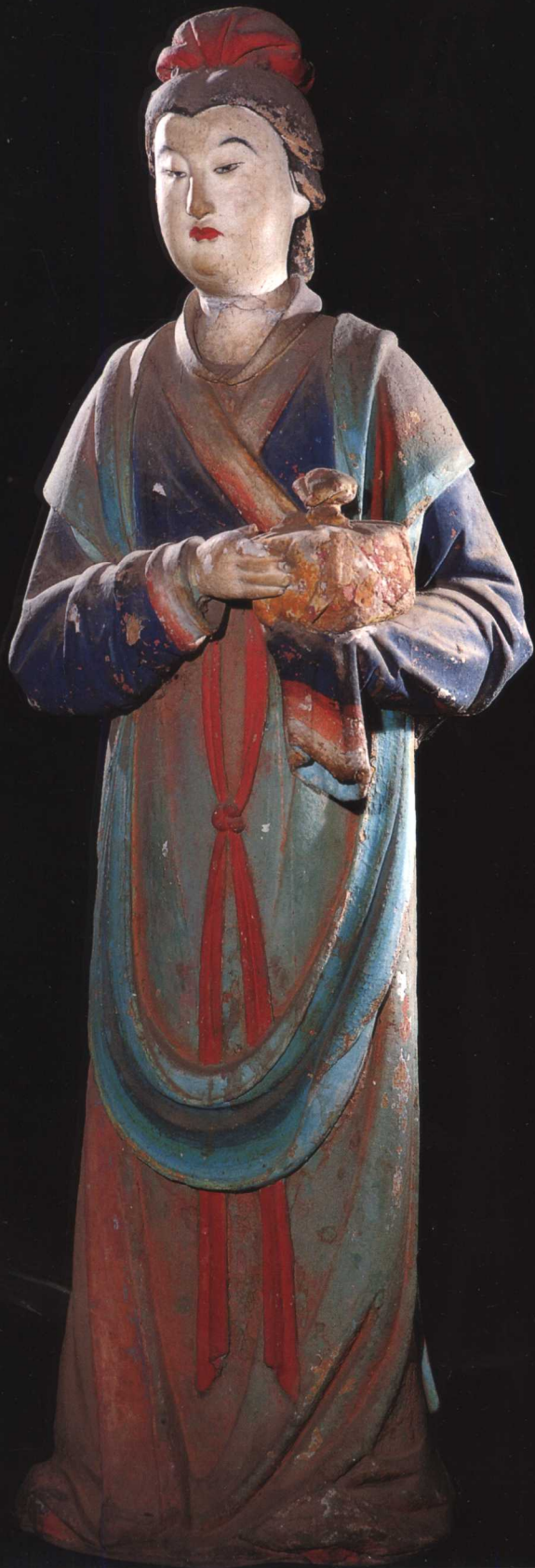
侍女 宋 晋祠圣母殿