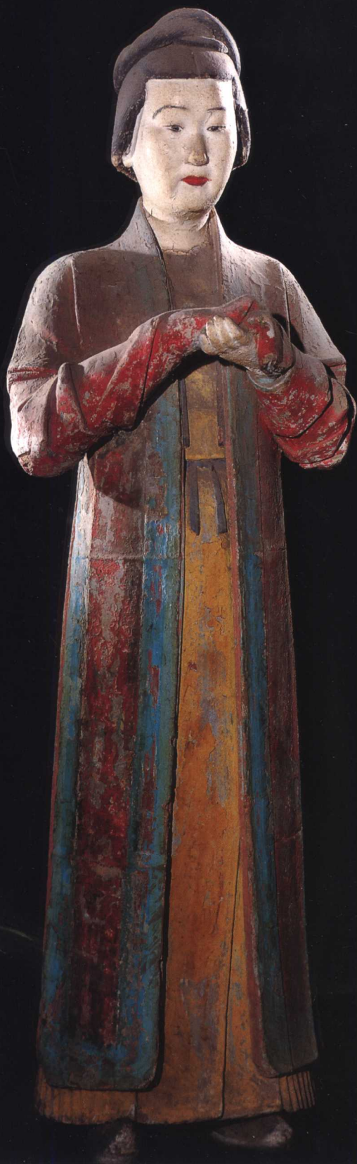
侍女 宋 晋祠圣母殿