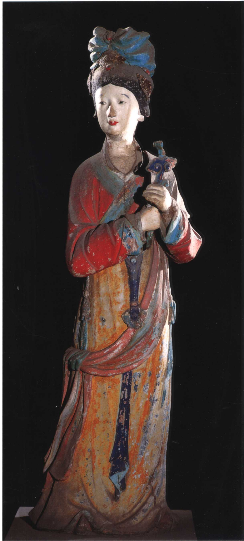
侍女 宋 晋祠圣母殿