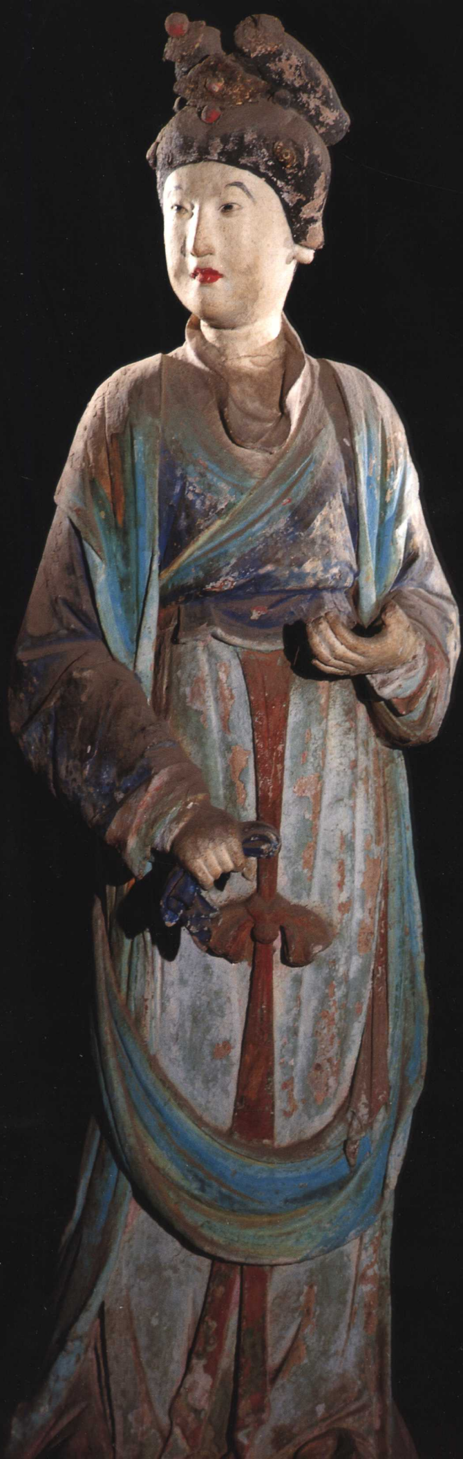
侍女 宋 晋祠圣母殿