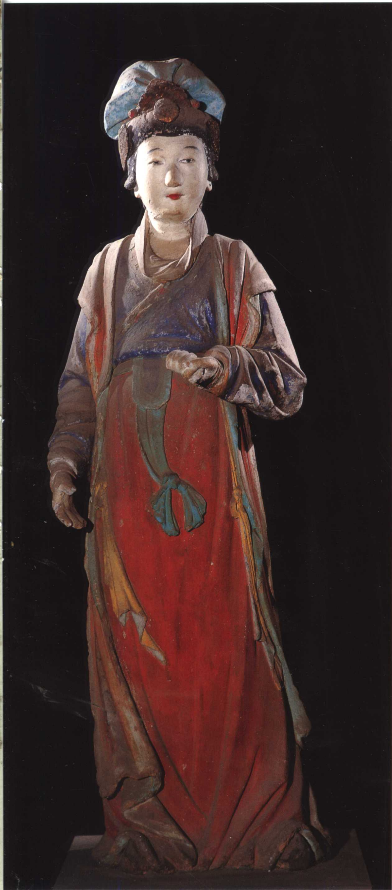
侍女 宋 晋祠圣母殿