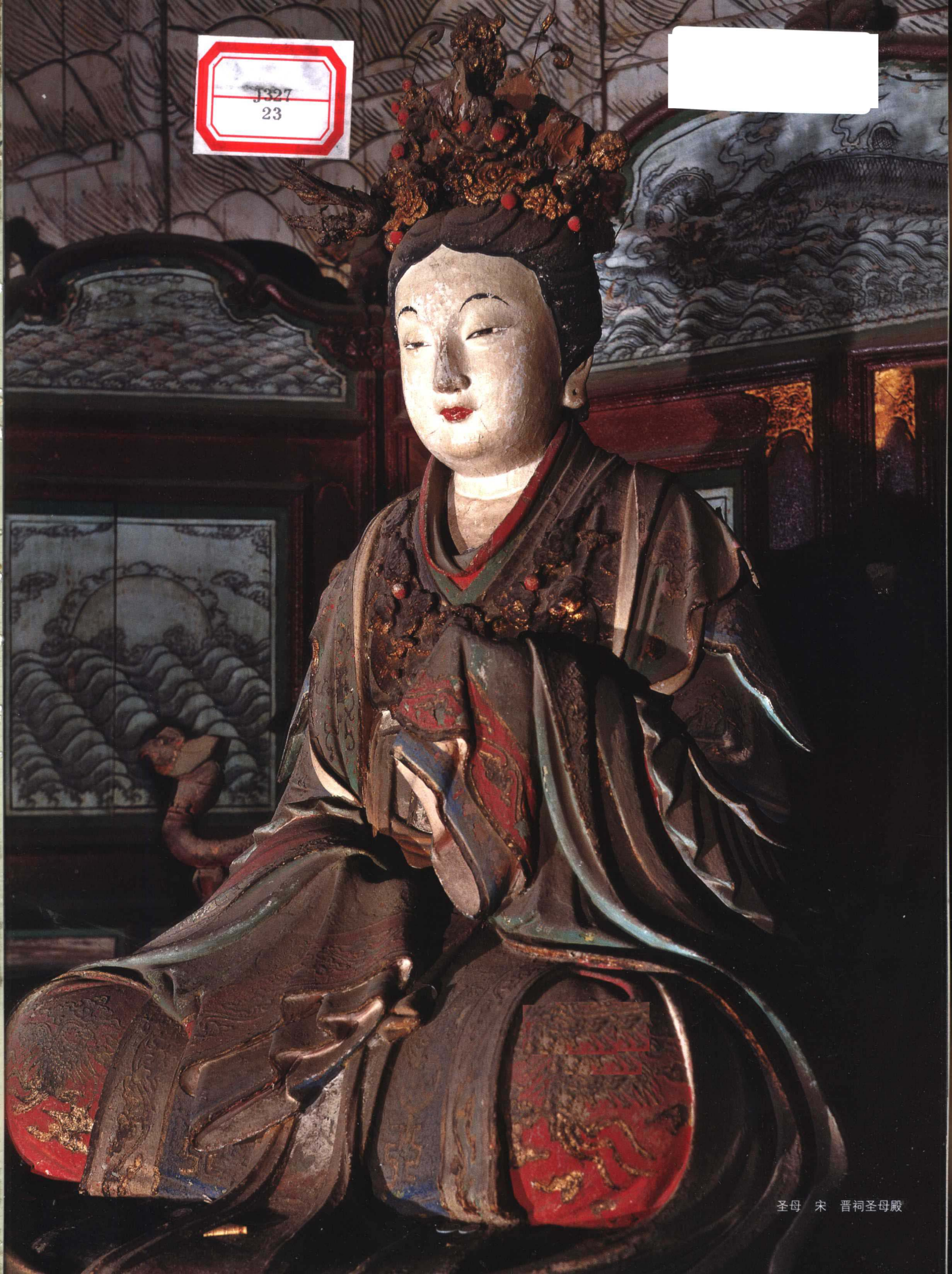
圣母 宋 晋祠圣母殿