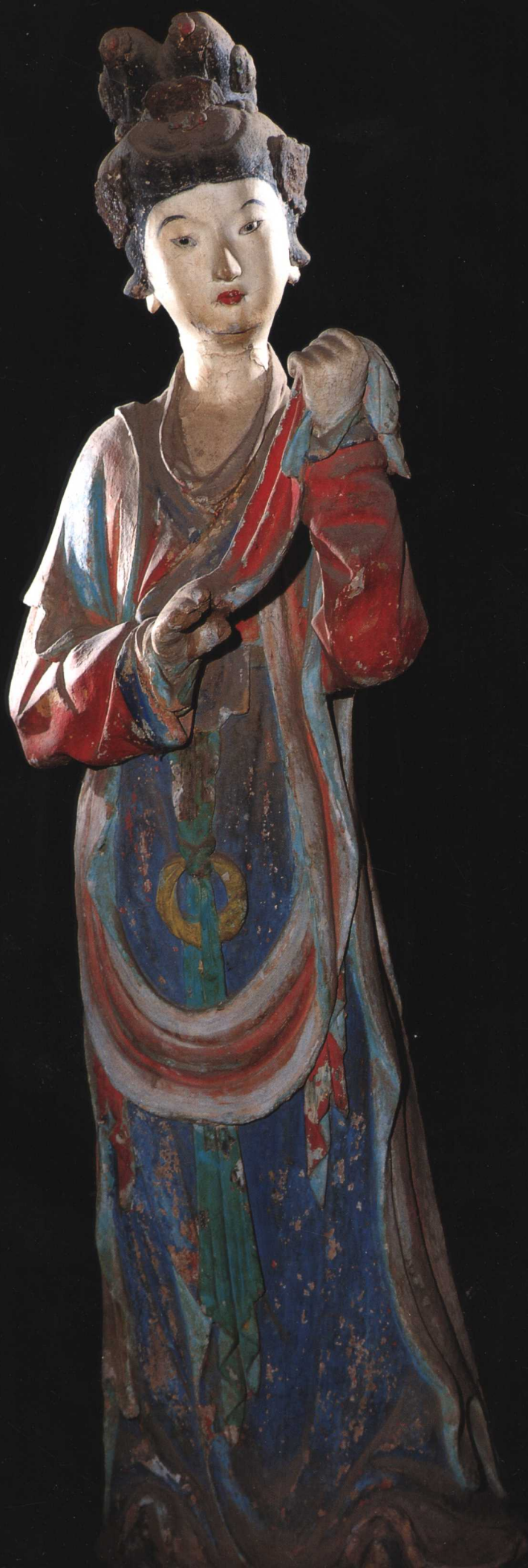
侍女 宋 晋祠圣母殿