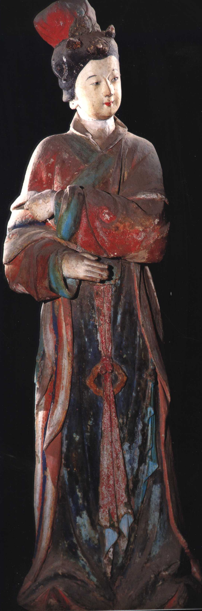
侍女 宋 晋祠圣母殿