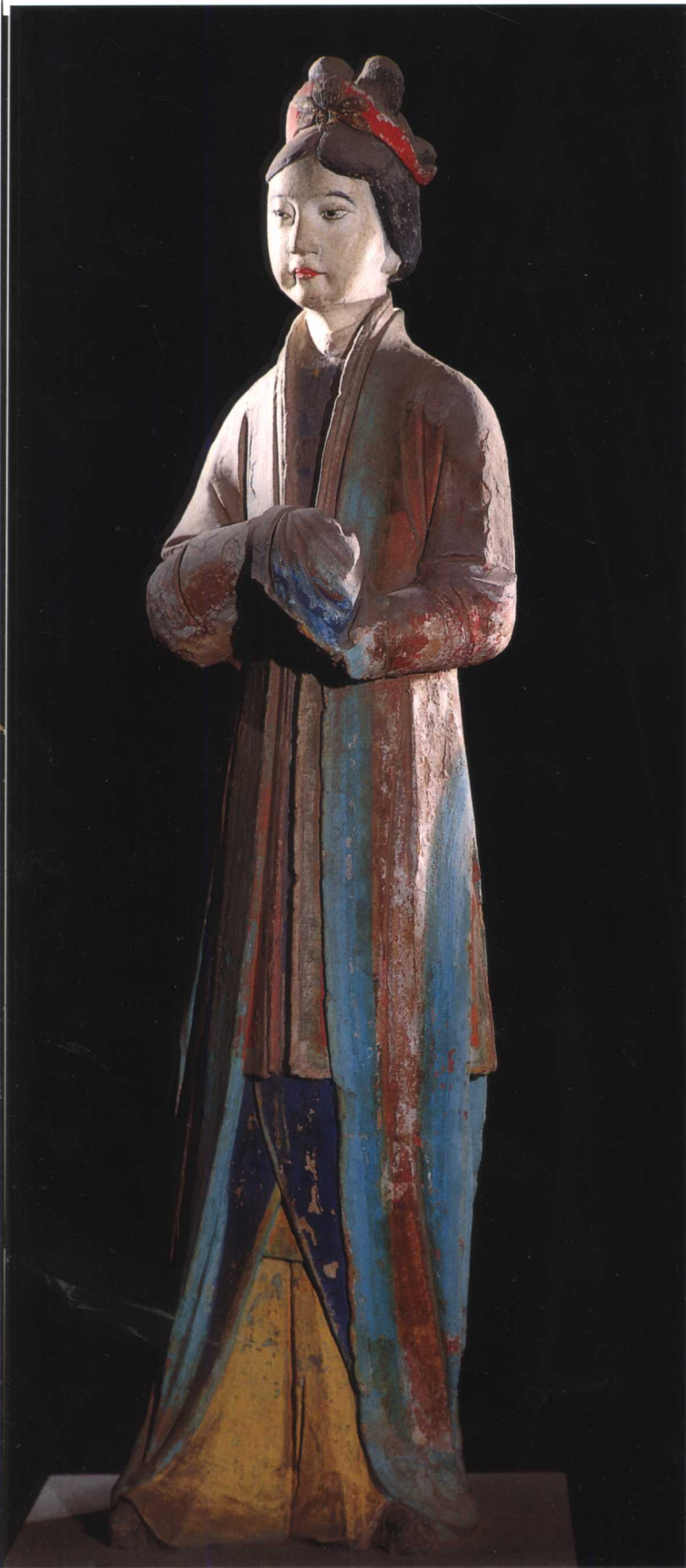
侍女 宋 晋祠圣母殿