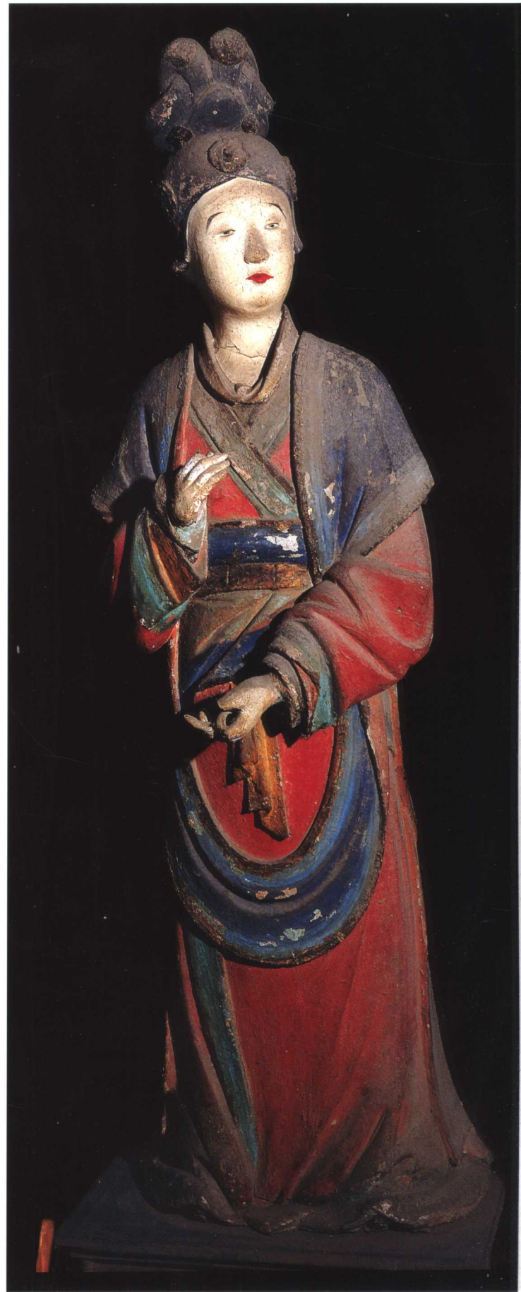
侍女 宋 晋祠圣母殿