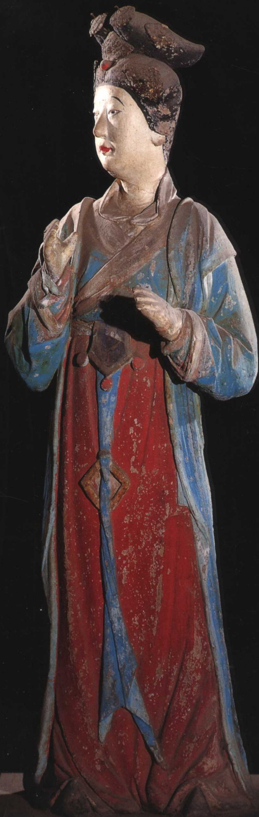
侍女 宋 晋祠圣母殿