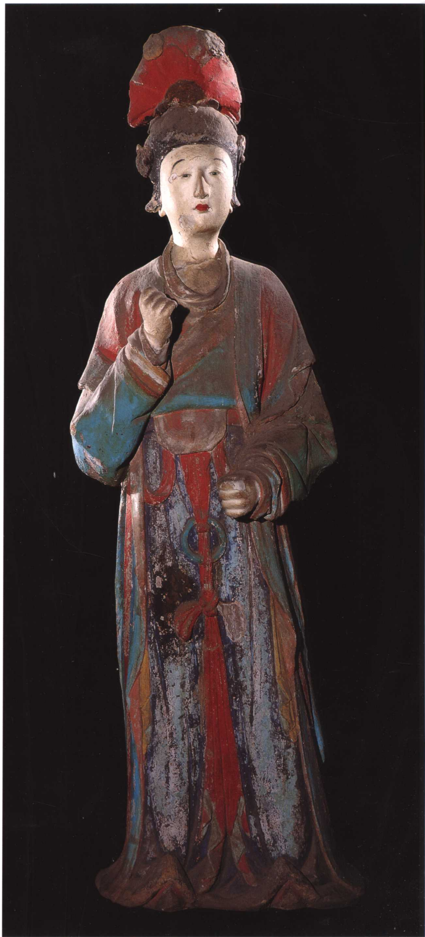
侍女 宋 晋祠圣母殿