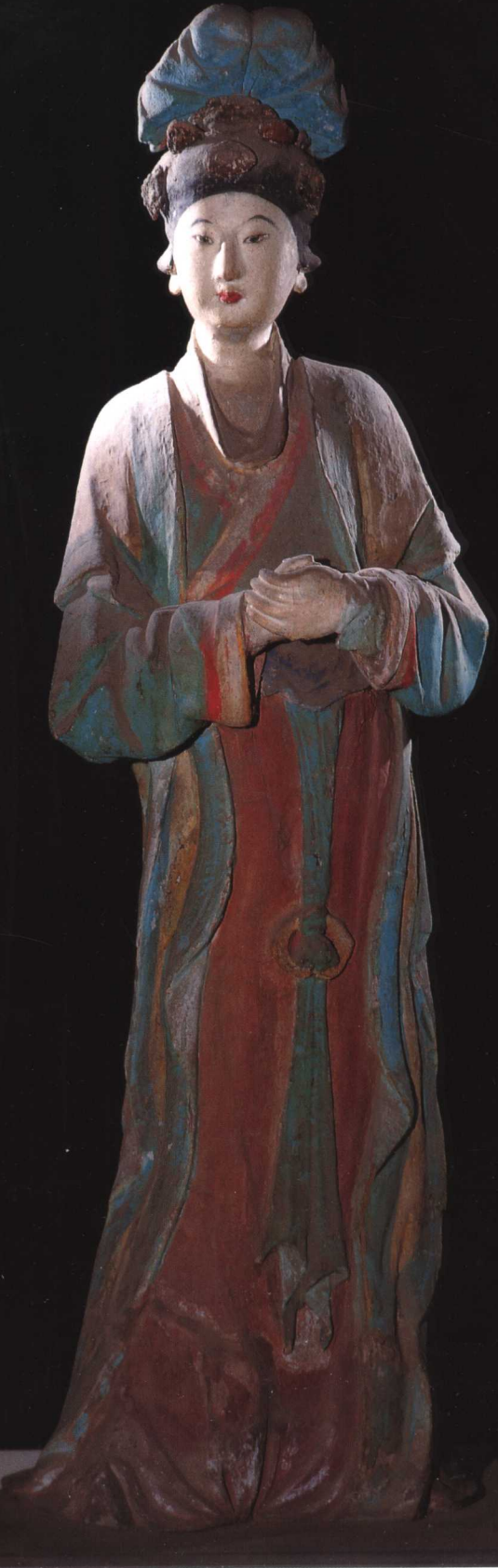
侍女 宋 晋祠圣母殿