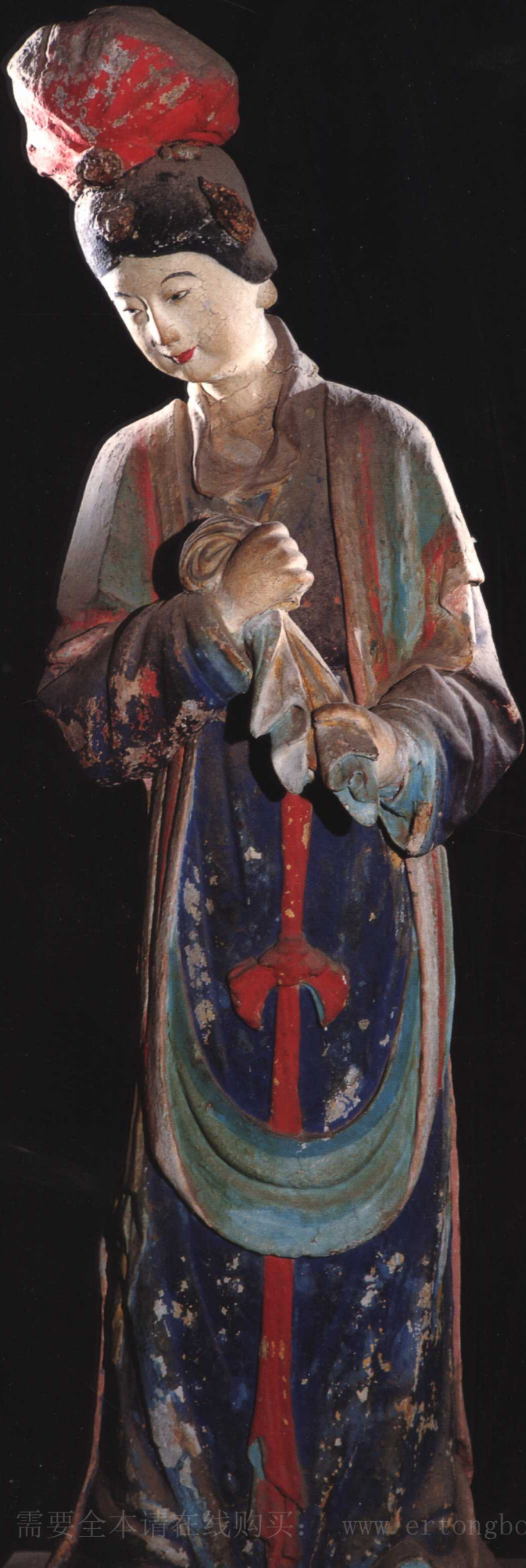
侍女 宋 晋祠圣母殿