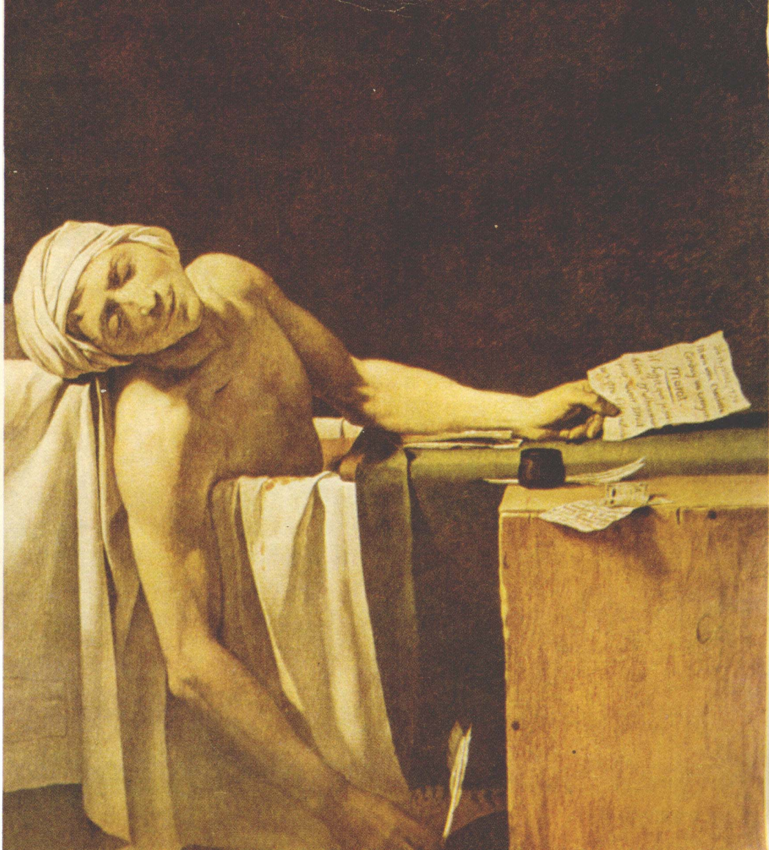
大 卫 (1748~1825)