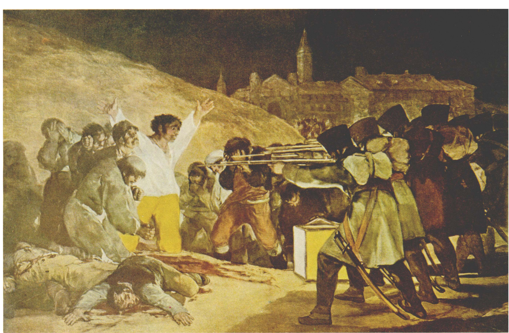
法国士兵枪杀西班牙起义者