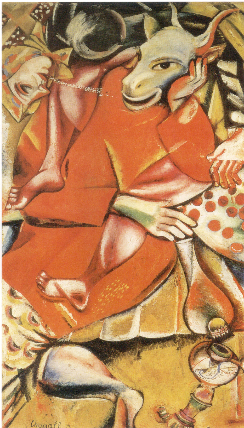
6. 献给我的未婚妻 1911年， 布面油画， 196 × 114.5厘米， 伯尔尼，艺术博 物馆