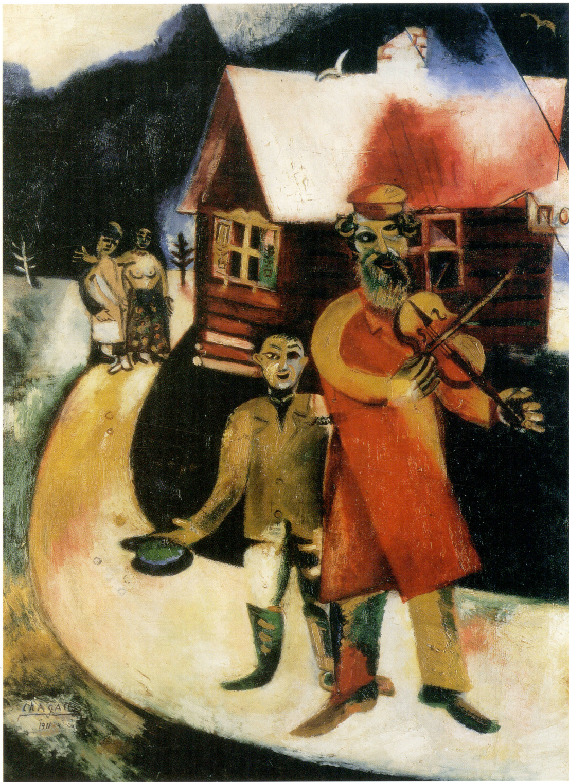
8. 月色（俄罗斯乡村） 布面油画， 126 × 104厘米， 慕尼黑，巴伐利亚国 立现代艺术画廊