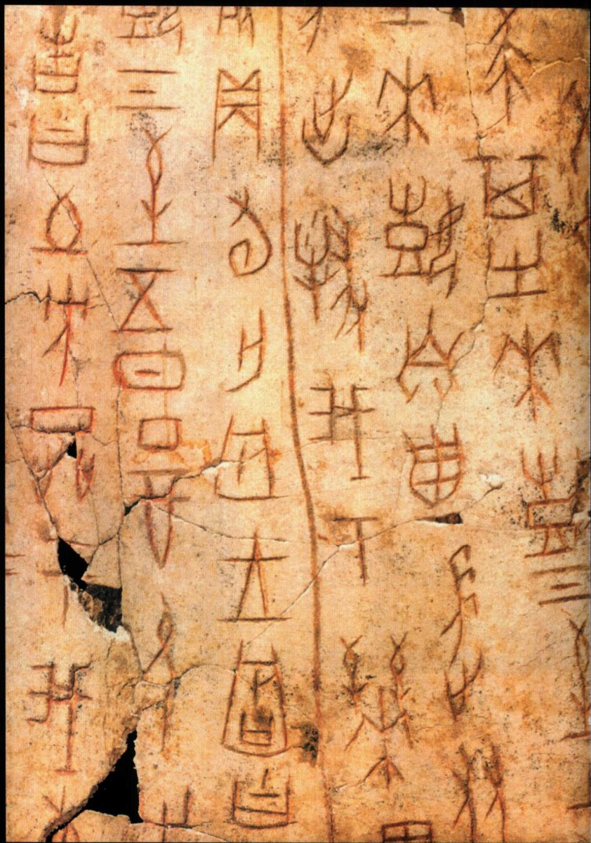
安阳殷墟出土的一块刻有文字的甲骨细部