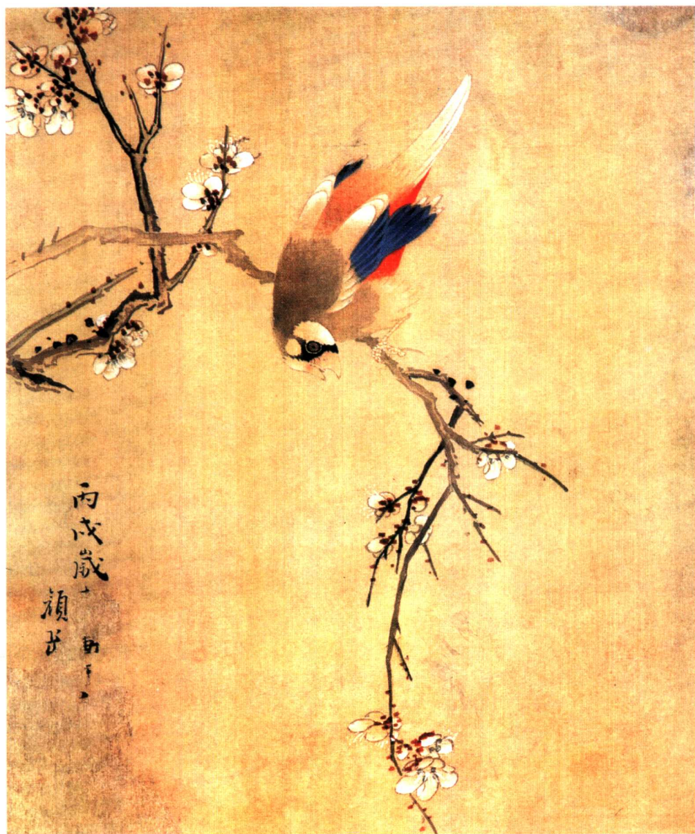
《花鸟图》，颜岳作。《说文》：“鸟，长尾禽总名也。象形。”“鸟”是个纯象形字。从甲、金文的形体看，“鸟”的本义当为飞禽的通名，也不一定长尾禽都从“鸟”。……详见本书第231页。>>>>