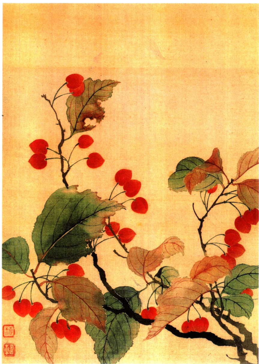
《花卉图·秋海棠》，恽寿平作。《说文》：“华，荣也。”许慎说的“荣”，也就是“华”。《尔雅·释草》：“木谓之华，草谓之荣。”“华”的本义就是花。……详见本书第240页。>>>>