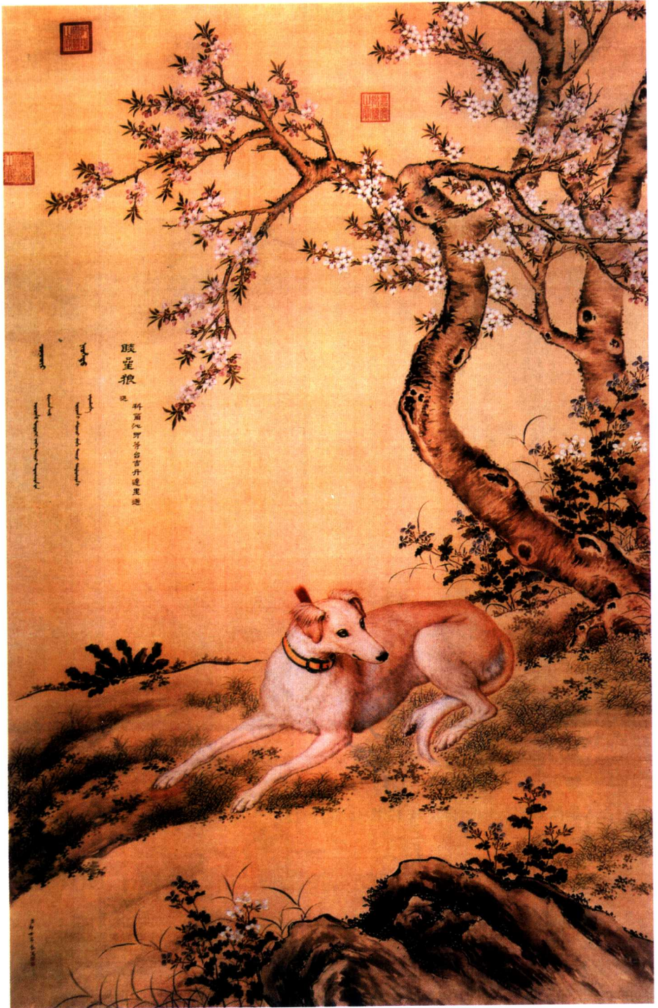
《十骏犬·啖星狼》，郎世宁作。《说文》：“犬，狗之有县蹄者也。象形。”“狗”与“犬”是有区别的。……详见本书第77页。>>>>