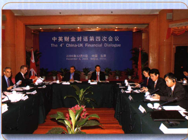
◎ 2004年12月6日，中英财金对话第四次会议在北京举行，财政部副部长李勇出席会议。