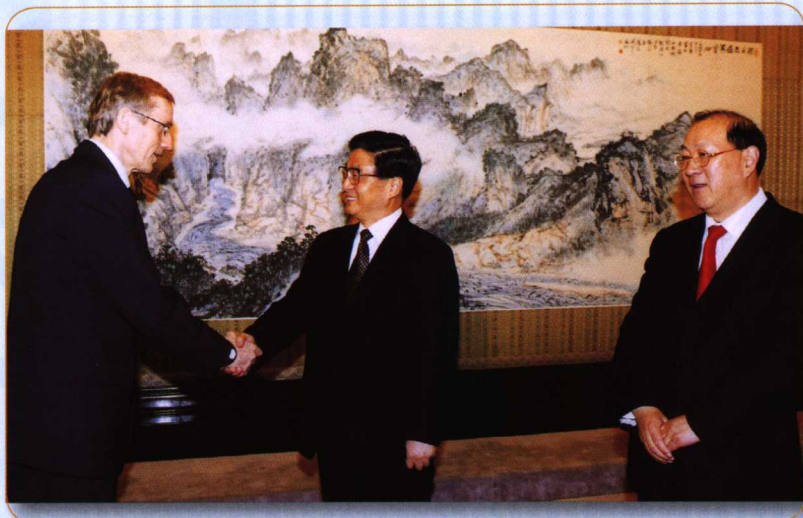
◎ 2004年3月16日，国务院副总理黄菊会见芬兰副总理兼财长卡里奥麦基先生一行。财政部部长金人庆作陪。