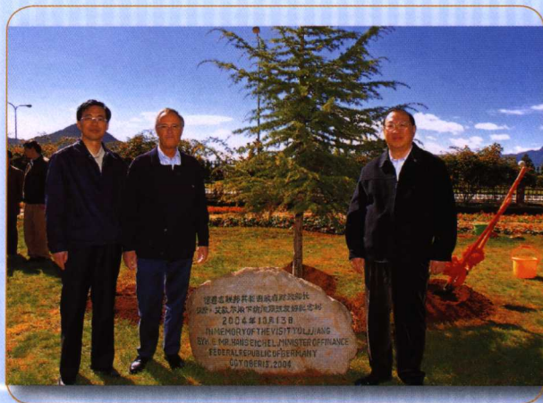
◎ 2004年10月13日，财政部部长金人庆与来访的德国财长汉斯·艾歇尔在云南丽江共同种下友好纪念树。