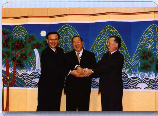
◎ 2004年5月15日，第七次东盟—中日韩财长会议在韩国济州岛举行。图为金人庆部长与日韩两国财长亲切会面。