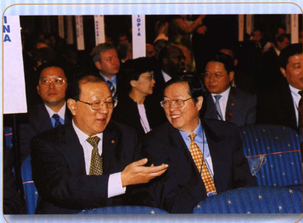
◎ 2004年10月2日，财政部部长金人庆和中国人民银行行长周小川代表中国政府出席世界银行年会。