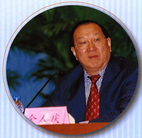
◎ 2004年12月21日，财政部部长金人庆在全国财政工作会议上作报告。