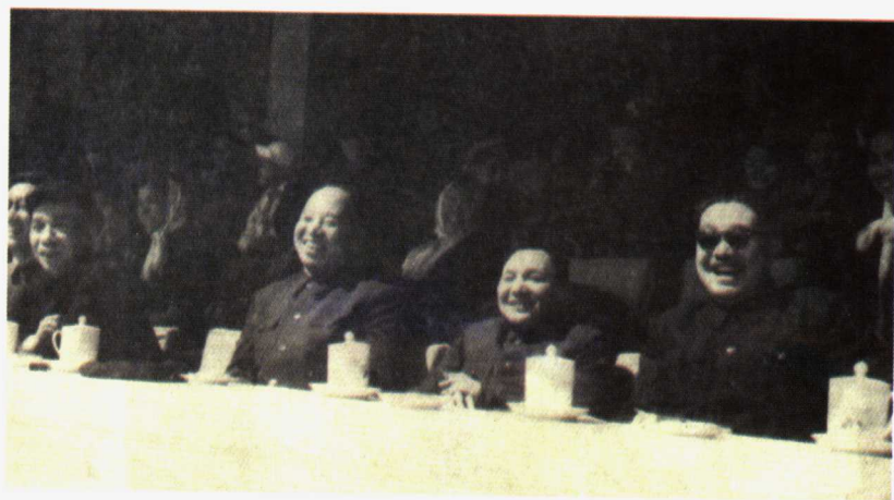
1960年“五一”国际劳动节北京工人体育场举行足球表演赛，图 为贺龙、邓小平、彭真、李富春等观看比赛。