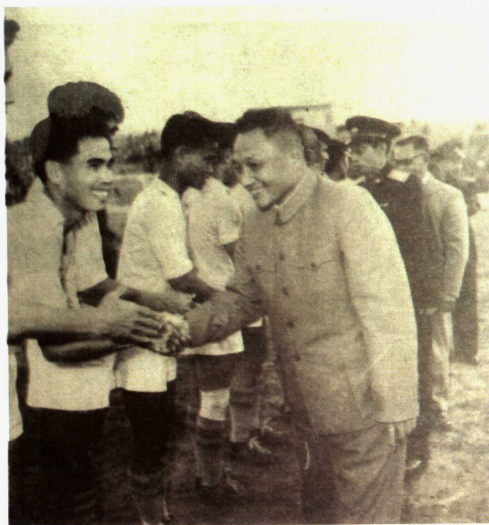
1962年10月5日，邓小平副总理接见了来我国访问的越南人民军足球队。