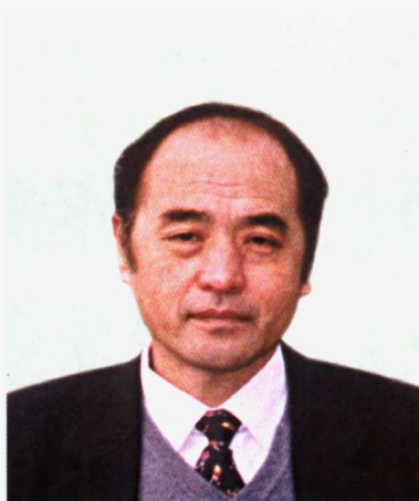
中国足球协会专职副主席