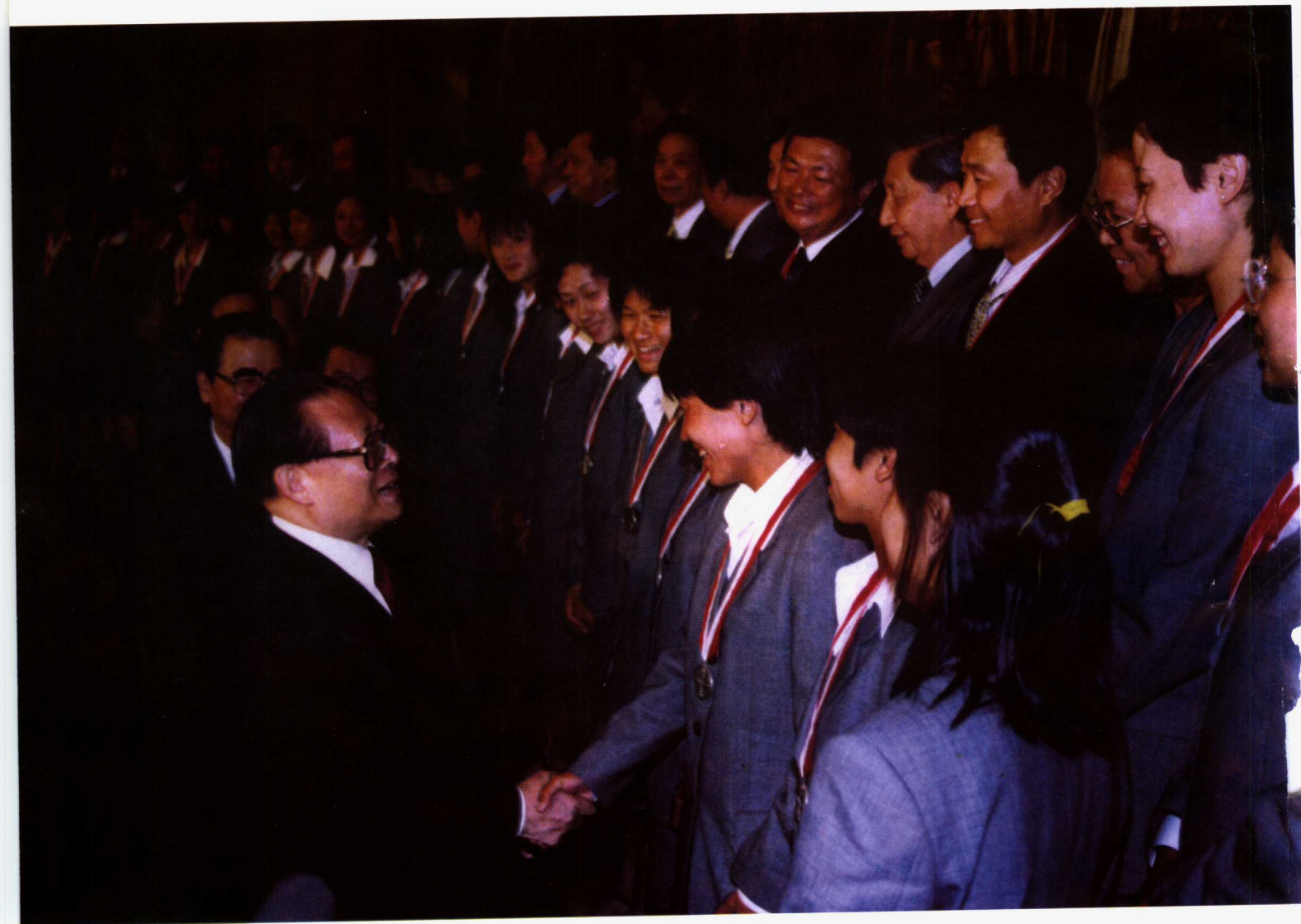
江泽民主席等党和国家领导人亲切接见获得第三届世界女子足球锦标赛亚军的中国女子足球队全体成员。