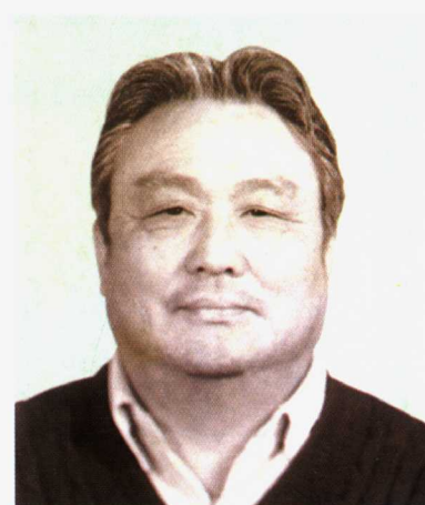
中国足球协会顾问