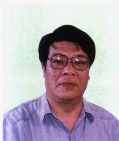
中国足球协会专职副主席