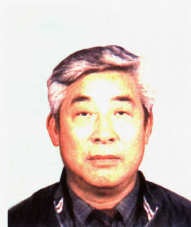
中国足球协会专职副主席