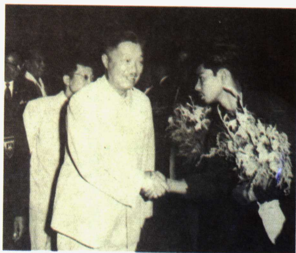
贺龙副总理接见来访的越南足球队。