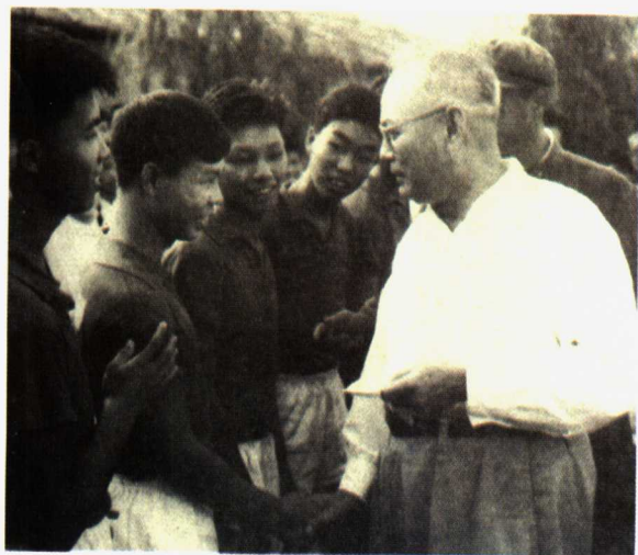
1964年叶剑英元帅看望梅县东山中学少年 足球队。