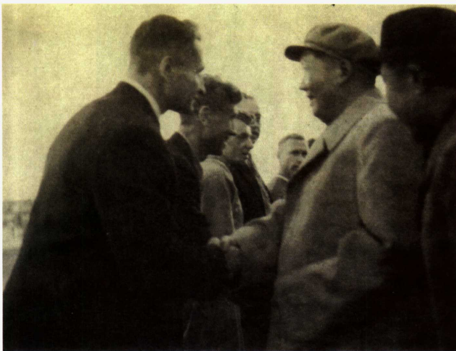
1955年10月30日，毛泽东主席亲临先农坛体育场观看中苏足球友谊比赛。图为毛泽东主席接见苏联泽尼特足球队的情景。