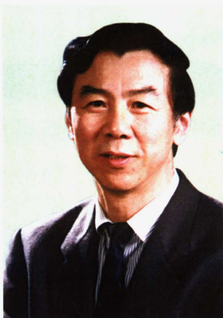
中国足球协会主席