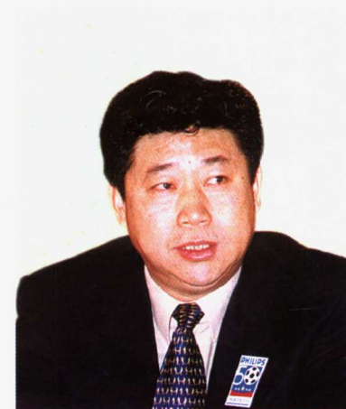
中国足球协会专职副主席