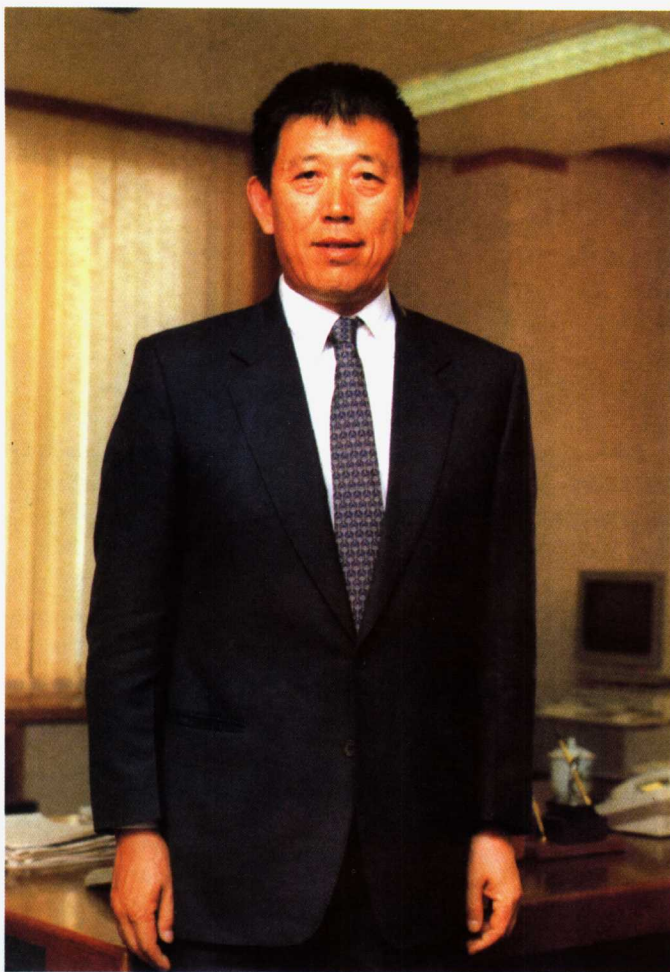
中国国际信托投资公司董事长 中国足球协会副主席 北京国安足球俱乐部董事长