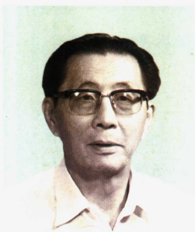
中国足球协会顾问