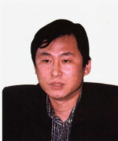
中国足球协会专职副主席