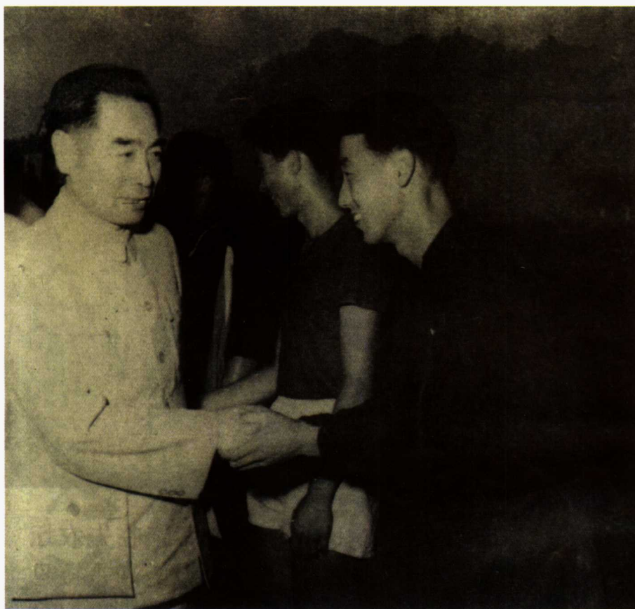
1956年9月，周恩来总理观看中国与巴基斯坦足球比赛后，接见双方运动员。图为周恩来总理与我国运动员张俊秀亲切握手的情景。