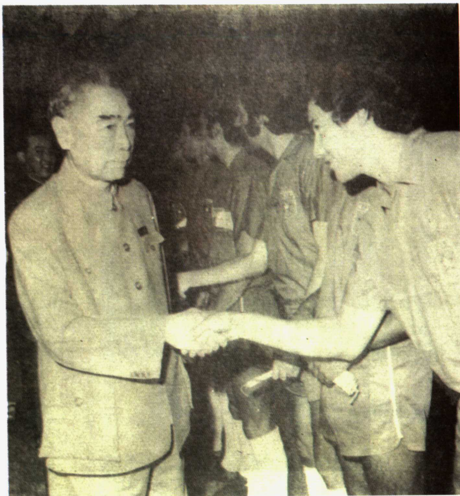
1972年6月30日，周恩来总理在百忙之中抽出时间观看了智利国家足球队的访华比赛，并接见全体队员。