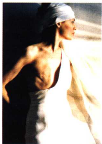
根切的乳房 玛图希卡 摄影 1993年