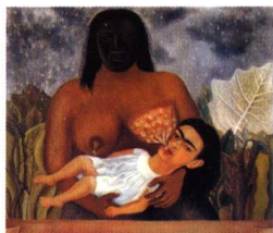
奶妈与我 弗里达·卡罗 油画 1937年

女人是卖方，也是买方 /176 没有内衣就没有服装工艺 /177 男人打造女体，左右内衣市场 /182 市场越做越大，紧身褙摇身变国宝 /184 女性健康政治宣言 /187 价值1500万美元的专利 /189 从鱼雷到子弹，胸罩的黄金年代 /191 无形、隐形到上空，穿不穿有关系 /193 平胸、丰胸40年一轮回 /196 只要看到乳房，男人就会买 /199 性感明信片的历史和胸罩一样久 /203 好莱坞不成文规矩：乳房越大越好 /205 摇臀晃乳，这也算娱乐吗？ /208 购买性感商品是通往幸福生活的关键 /211 阴茎增大术，欢迎有兴趣的男士一试 /213 鱼与熊掌：言论自由与免于恐惧的自由 /218