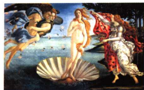
维纳斯的诞生 桑德罗·波提切利 油画 1486年

在没有乳房的荒漠中流浪 /159 如果佛洛伊德是女人 /162 母亲与爱人共享一个乳房 /166 复制社会既存的父权思想 /169 在吸吮与性欲之外的意义 /171