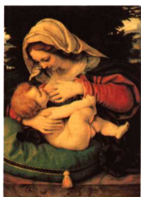
感动世人的温馨 安德利亚·索拉瑞奥 油画 16世纪