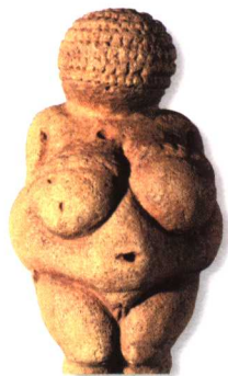
丰产仪式中的女神 公元前4500年 大英博物馆藏