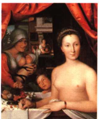
嘉柏莉出浴图 弗朗索瓦·克卢埃 油画 1571年