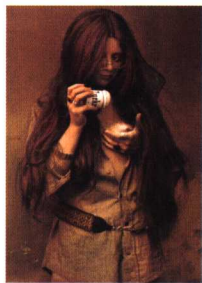
关心自我 杨·索代克 摄影 20世纪80年代

古人认为女人的身体不如男人完美 /224 欧洲第一所医学院男女兼收 /226 13世纪的医师就知道乳房自我检查 /228 产婆与奶妈连成女性医疗者网路 /229 直到19世纪人们依然深信癌症会传染 /232 既无挣扎、也无反抗，甚至没有抱怨 /235 最早的乳癌患者自述，勇气可嘉 /237 医界自认是女人身体的捍卫者 /240 癌症妇女有了前所未有的选择 /243 全球流行病：每年100万人死于乳癌 /246 面对最悲惨的结果，享受最好的生活 /248 隆胸是为了自己，不为取悦男人？ /250 女人减胸，男人反对，医生怕怕 /252