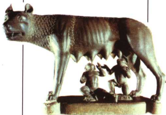
罗马的传说 公元前480年 大英博物馆藏