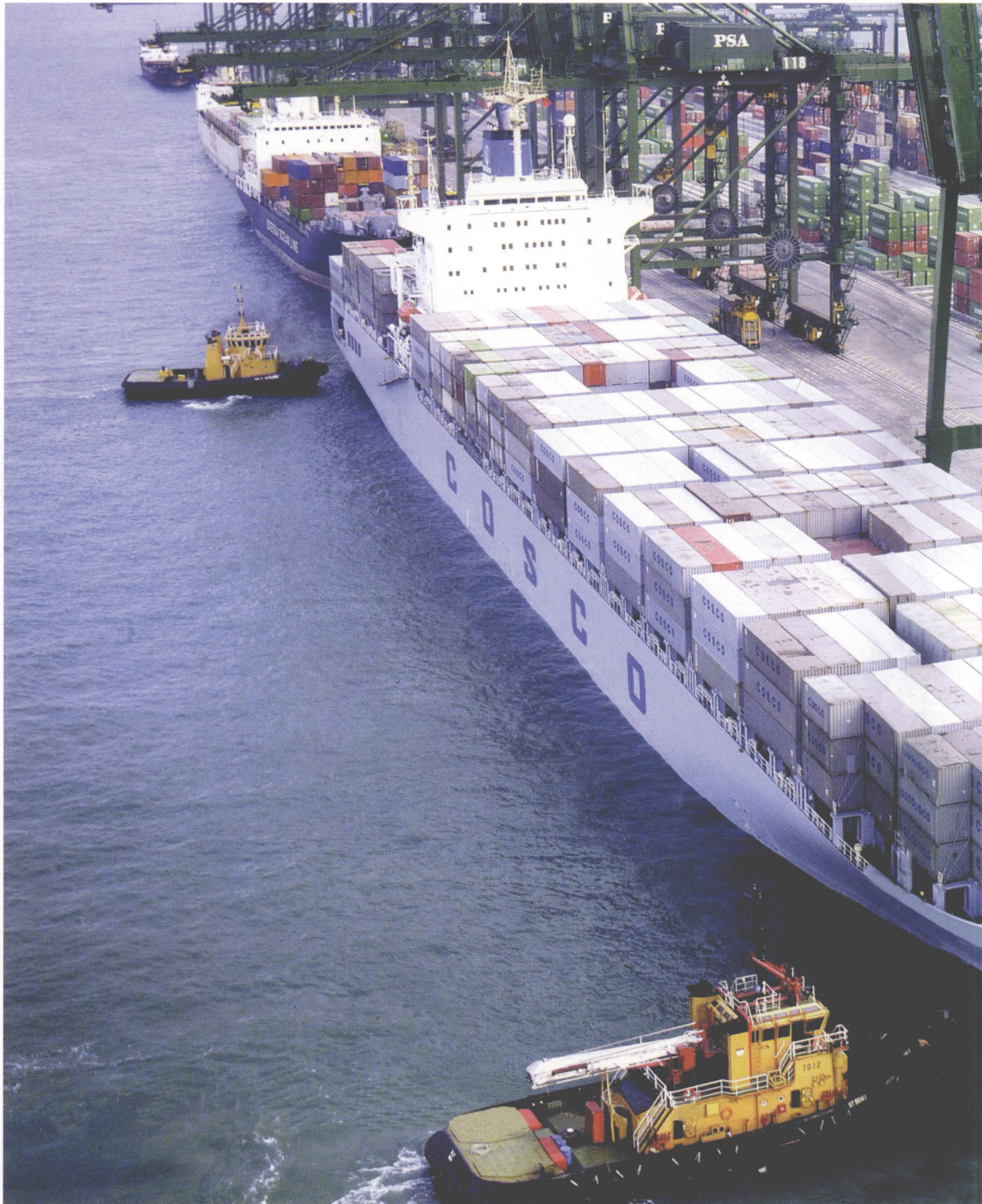
中远集团 3800TEU 型集装箱船“珍河”号