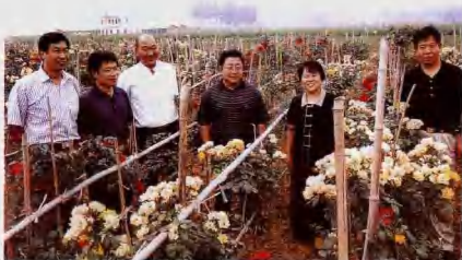
2002年6月19日，省委书记陈奎元(右三)在卧龙区委书记田向和(右二)、区长王吉波(右一)的陪同下视察卧龙区石桥镇花圃基地。