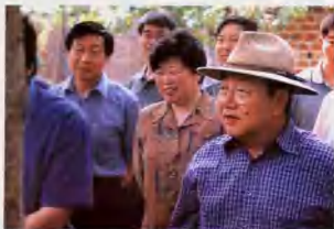
2002年6月20日，省委书记陈奎元(右一)在新野县委书记赵焕之(右二)、县长方显中(右三)的陪同下视察新野县沙堰镇猕猴桃繁殖驯养基地。