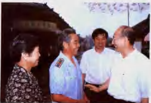
2002年9月9日，省委副书记支树平到社旗视察工作。图为支树平(右)在县委书记李中杰(右二)陪同下接见全国劳动模范范自强(左二)。