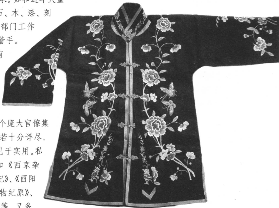
图1-4 民国时期的绣花女装

周锡保和他的《中国古代服饰史》是服装史研究中另一部重要的专著。由于从事戏剧学院服装史教学研究,在极其缺乏资料与研究条件的情况下,周先生花了数十年的工夫,呕心沥血,孜孜不倦,从史料出发,同时遍走博物馆,细考藏品,详作研究,付出了数倍的辛苦而成就此书。