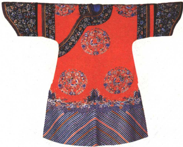
图 1-1 红缎绣喜相逢九团女夹袍