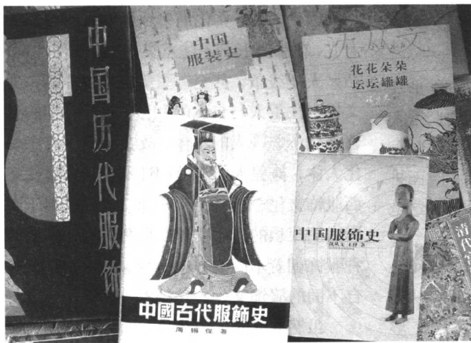
图1-3 部分当代“中国服装史”研究成果

著名学者沈从文从那时开始了这件对他来讲也是陌生、苦涩的任务。沈先生呕心沥血，完成了巨著《中国古代服饰研究》。这部著作历经磨难，终于在20世纪80年代首先在香港面世。著作问世后便引起华人学界的轰动，该书可成为中国服装史研究之第一书。沈先生的史论是以史实为基础，继而进行考据、分析的，这是目前最具权威的服装史论著作(图1-3)。