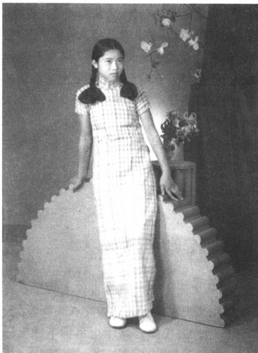
图 1-2 现代旗袍是中外服饰文化结合的产物（传世照片）

过程中，都不可避免地与异族文化交流，历史已证明这一点。任何把“传统”视为纯而又纯的观点，是历史的无知，也不是历史的事实。