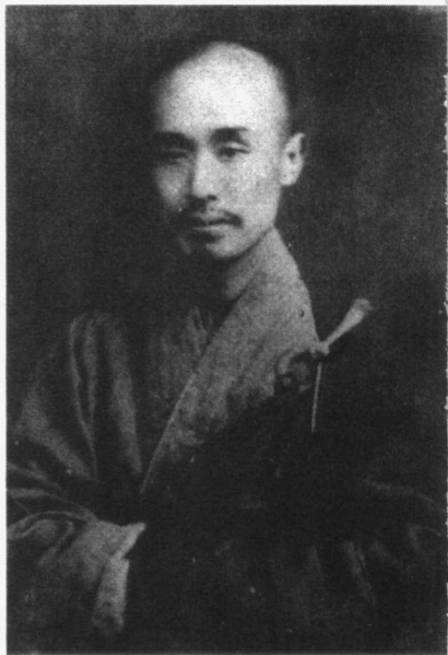
弘一大师 1919 年在西湖玉泉寺

到了这一年放年假的时候，我并没有回家去，而到虎跑寺里面去过年。我仍住在方丈楼下。那个时候，则更觉得有兴味了，于是就发心出家。同时就想拜那位住在方丈楼上的出家人做师父。