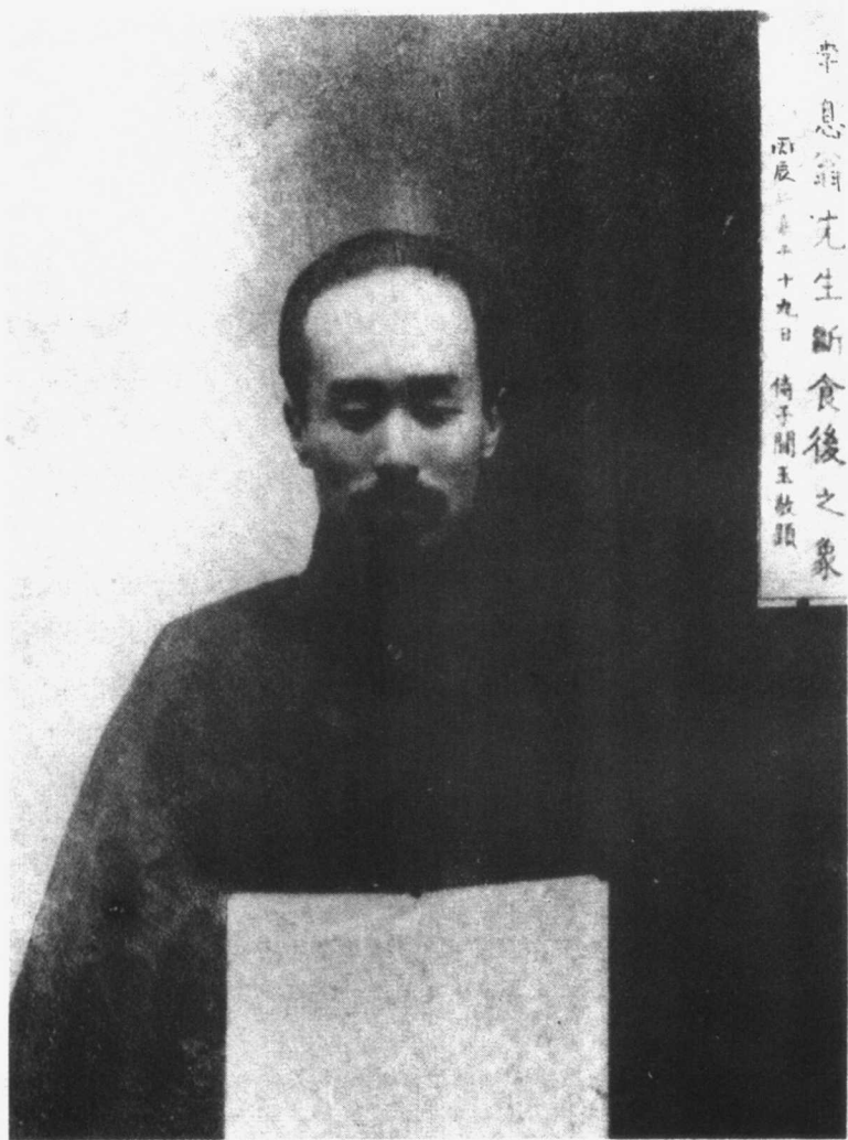
李叔同 1916 年冬断食后照片(37 岁)