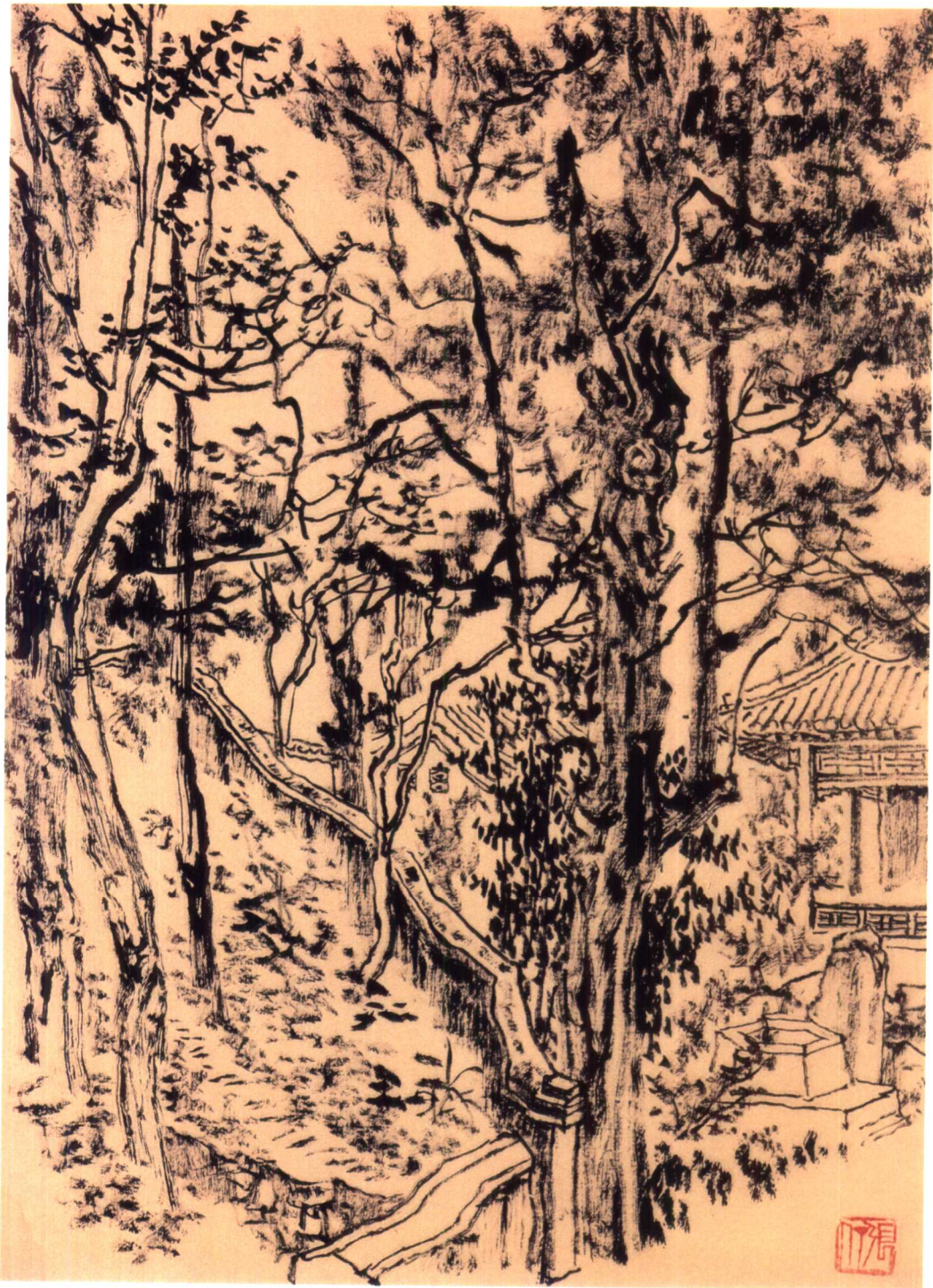
作品名称：香山(一) / 创作年代：1974年