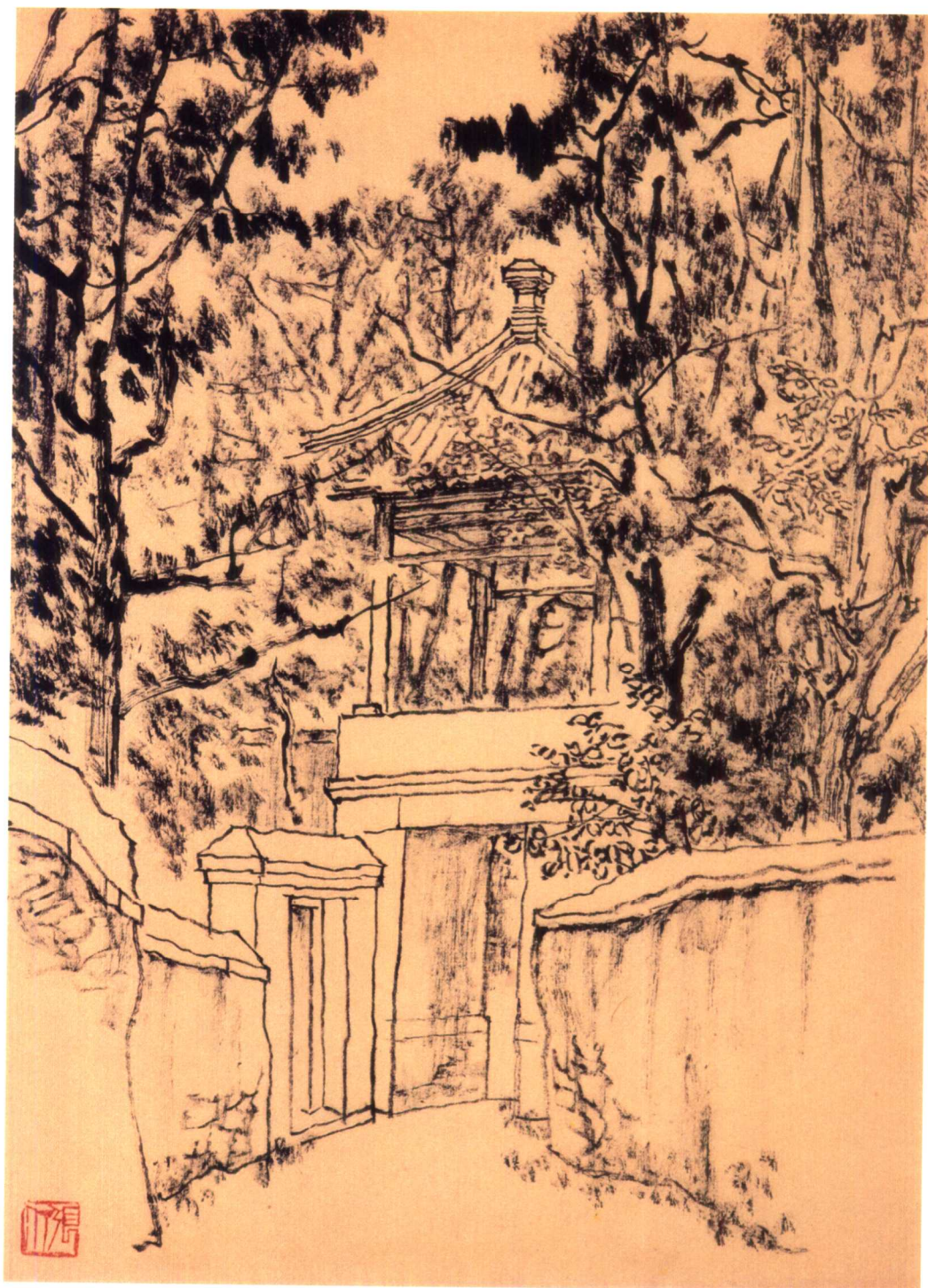
作品名称：香山(二) / 创作年代：1974年