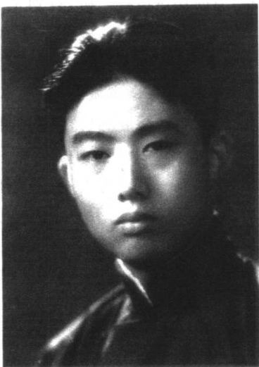
1934年7月1日，到上海找党组织，在钱庄作学徒时留影

我初小毕业后，考进凤阳第一高等小学，这个高小教学水平较高，校长和一些教师都比较进步，其中有共产党员，这时是1927年，我11岁，正是大革命时期，通过老师教育，了解北伐军取得胜利了，只有打倒军阀，才能使老百姓过上好日子。因为过去一些军阀的军队到凤阳，总是抢东西，欺侮老百姓，招不到兵，就强制拉壮丁。我虽不知道军阀的本质，但知道他们是坏人，干坏事。国民革命军打到凤