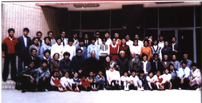
母亲百岁寿辰全家合影