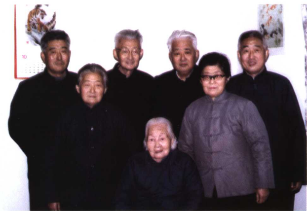
老母亲与 我们兄妹合影