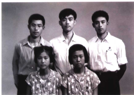
三个儿子和两个女儿